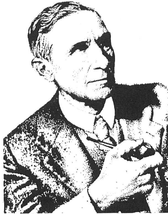
POMPEU FABRA, la llengua d'un poble 1868 / 1968