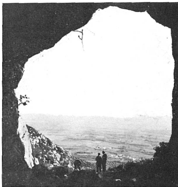
La plana de Torroella des de l'interior del Cau del Duc.