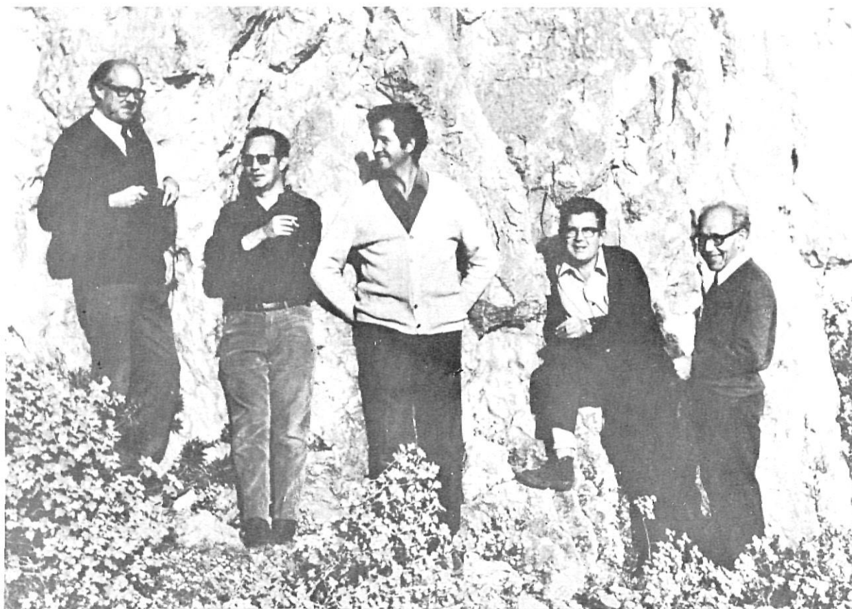
Els membres de l'A.A. de Girona que visitaren el jaciment el 22-11-72.