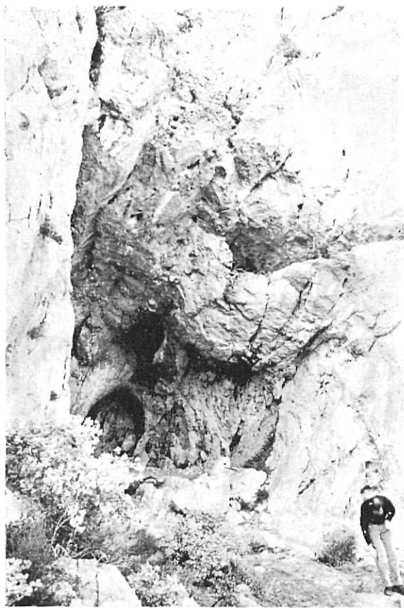
Detall de l'interior del Cau del Duc.

lloc d'habitació, on havien viscut moltes generacions segurament en condicions molt precàries i en un medi ambient ben sovint hostil.