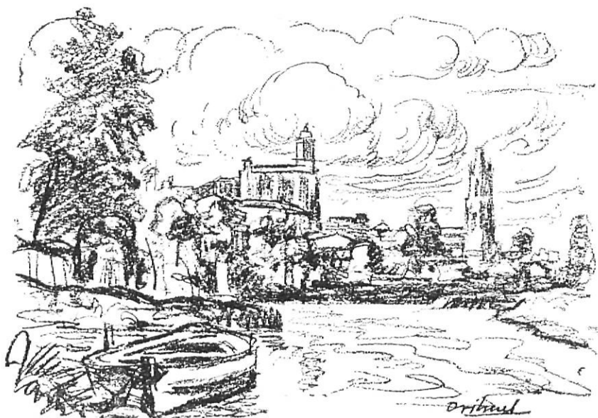
El riu Ter, amb la Catedral i Sant Feliu al fons, al seu pas per Pedret, vist per Orihuel.

La vinculació i la influència no van centrarse solament en les tècniques i l'estil, sinó també amb el sentir i expressar, això sí, perquè cada un d'ells, després fos fidel a la pròpia personalitat, a tot allò que ens envolta, tal com ho veiem i sentim, amb una mica de fantasia, o molta, per crear la pròpia obra. Que això també sabia explicar-ho en Joan Orihuel.