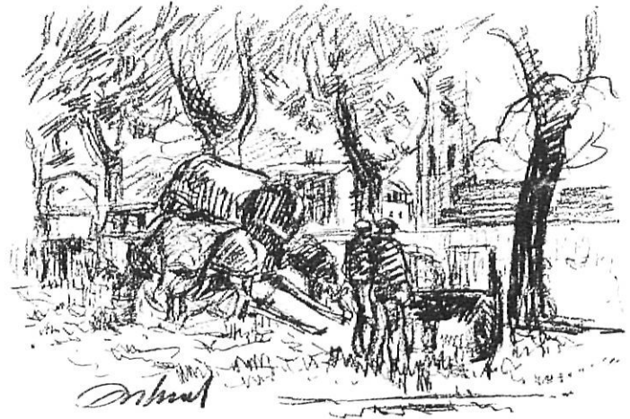
Una vista típica de la Devesa, dibuixada per Orihuel.

Els seus lligams amb Girona van ser així mateix de caràcter humà, i sota aquest aspecte encara el recordem més. Ell va anar a viure a la primera casa de la carretera de Santa Eugènia, i anava a les tavernes i al Casino. A tot arreu. Havia estat afeccionat a la boxa i més d'una vegada féu d'esparring d'algun professional. Gran conversador, era estimat en les tertúlies, ja que a la vegada tenia modals d'autèntic cavaller, i això sempre és agradable, i potser li obrí les portes de moltes famílies gironines, que li encarregaren retrats que ell interpretà amb gran esperit, i molts dels quals poguérem veure a l'exposició que ara comentem, ja que no foren solament els ex-alumnes i l'ajuntament els que feren possible la mostra homenatge, sinó que moltes famílies aportaren l'obra que tenien de l'artista, per tal que hi fos exhibida, a més d'institucions, corporacions, empreses, cases comercials —recordem la col·lecció de cartells—, i la Cambra de Comerç propietària de grans murals que hi figuraren.