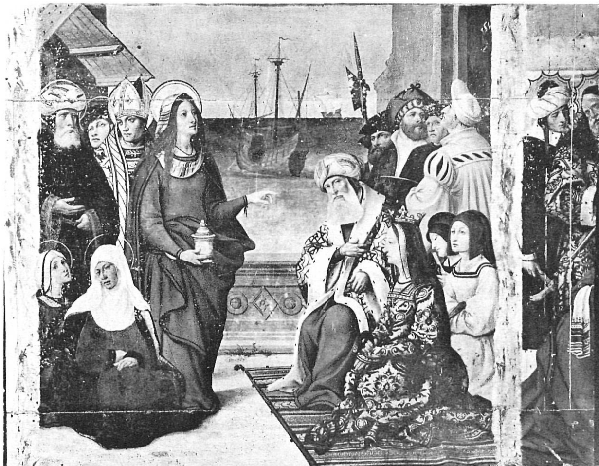
Maria Magdalena a Marsella. Retaule de la Catedral de Girona pintat entre 1526 i 1529.

a migdia pel mar, a occident per la sorra del mar i a cerc pel camí de cala Pedrosa (10).