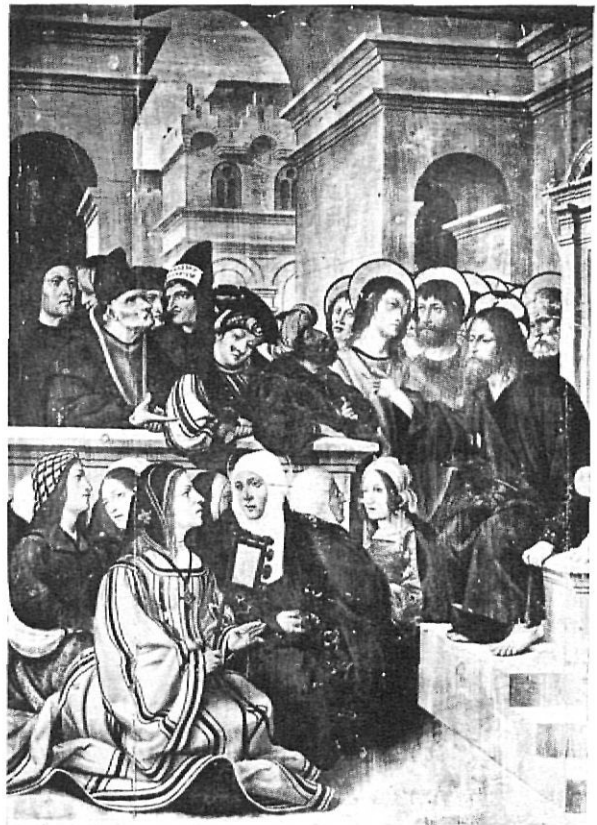
Predicació de Jesús. Retaule de Santa Magdalena, de la Catedral.