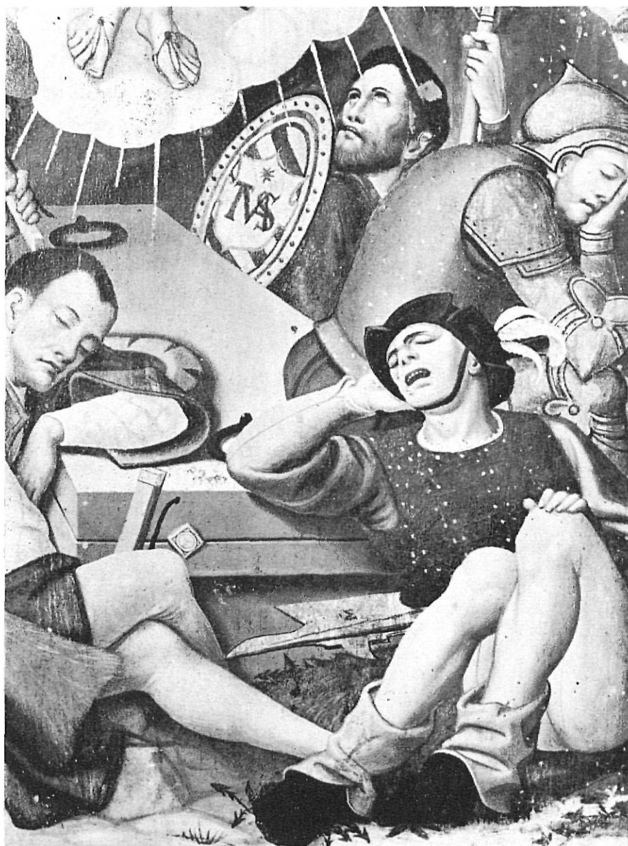
Detall de la Ressurrecció. Retaule de Segueró. El monograma del pintor és visible a l'escut i a la llança.