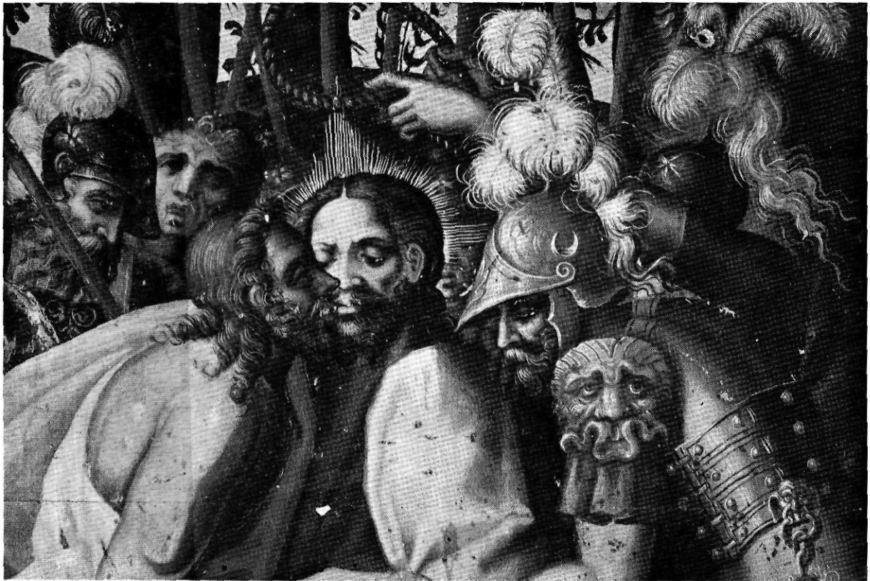
El bes de Judas. Detall de la tau·la dedicada a la captura de Jesús a l'hort de les Oliveres. Pintura de Perris de la Rocha

nam que hàjan pintar y acabar ab lo compliment susdit los dits quatre àngels, ço és, quiscu d.ells dits mestres dos àngels, y per ço tostemps y quant per los reverents protector y administradors de dita confraria seran requests hàjan prestar cautió fideiussòria a conaguda de dits senyors protector y administradors, de pintar y acabar com dalt és dit, los dits quatre àngels sots lo jurament y pena en dit compromís contenguts.