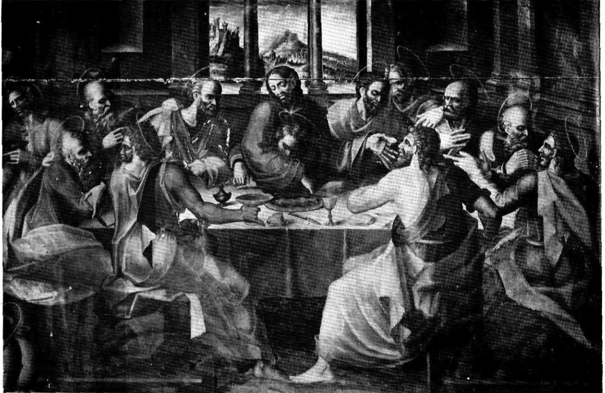
El Sant Sopar. Taula central del retaule. Remarquem, com a elements característics de l'obra, la posició de l'apòstol Joan, l'ondulet dels cabells i l'expressivitat dels rostres. Pintura de Perris de la Rocha (1567).

Una reinterpretació posterior de la sentència, establerta el 4 de febrer del mateix any, modificà sensiblement l'acabament de la feina pendent i, consegüentment, el repartiment de les retribucions. Els dos apartats bàsics d'aquesta nova arbitració deien això: