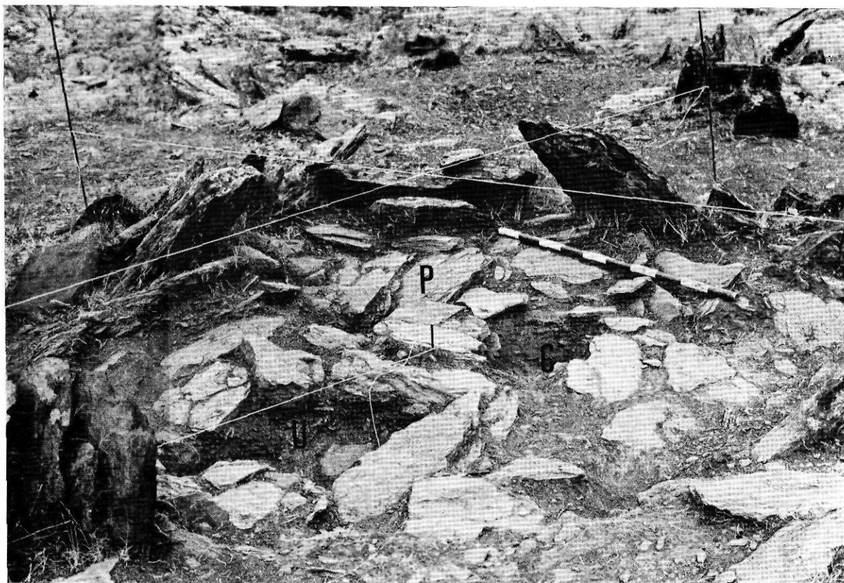
Fig. 2. - Túmul 3 - nivell 2n de la tomba: U = lloc de la urna; C = lloc de les cendres; p = passadís simulat orientat al Nord.