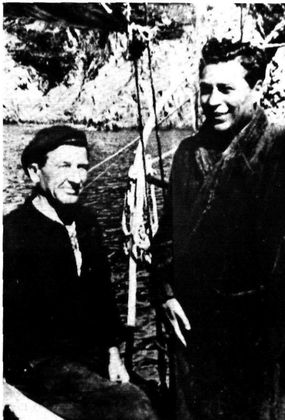
Amb un pescador de Tamariu, de jove.