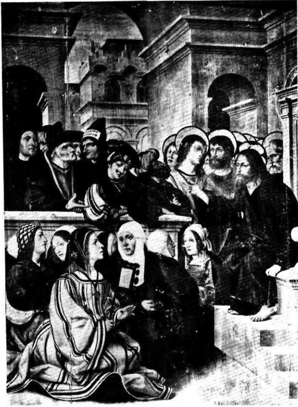
Detall del retaule de Santa Magdalena, obra de Pere Mates (1526).

Com documentarem més avall, el pintor va morir a Sant Feliu de Guíxols el 31 de març de 1570.