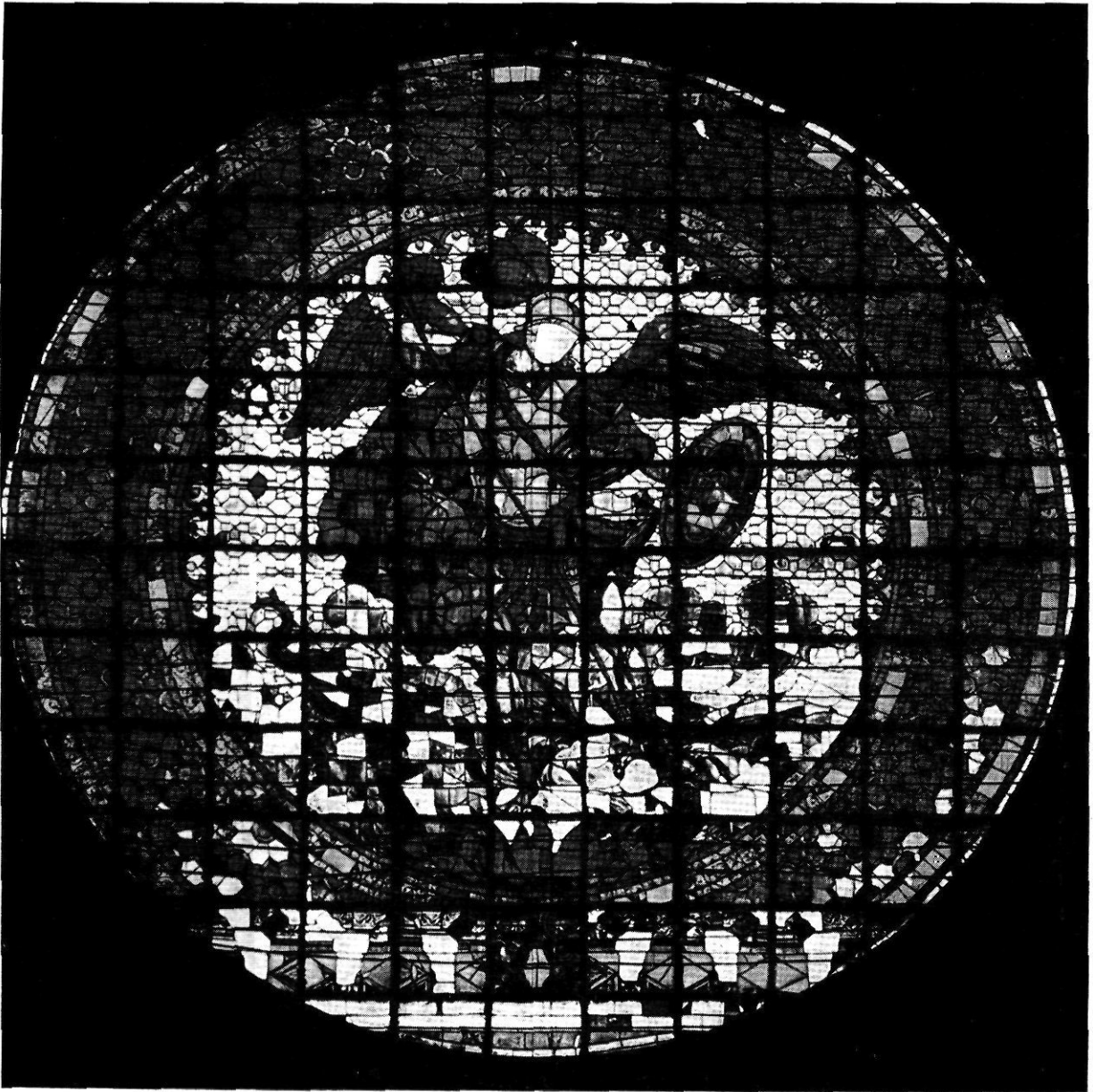
Vitrall de Sant Miquel, obrat a l'any 1704.

tedral, traient-la dels llibres d'Obra de l'Arxiu amb data de 21 de gener de 1380, que més avall transcriuré (El pintor Lluís Borrassà, Barcelona, 1925, pàg. 10).