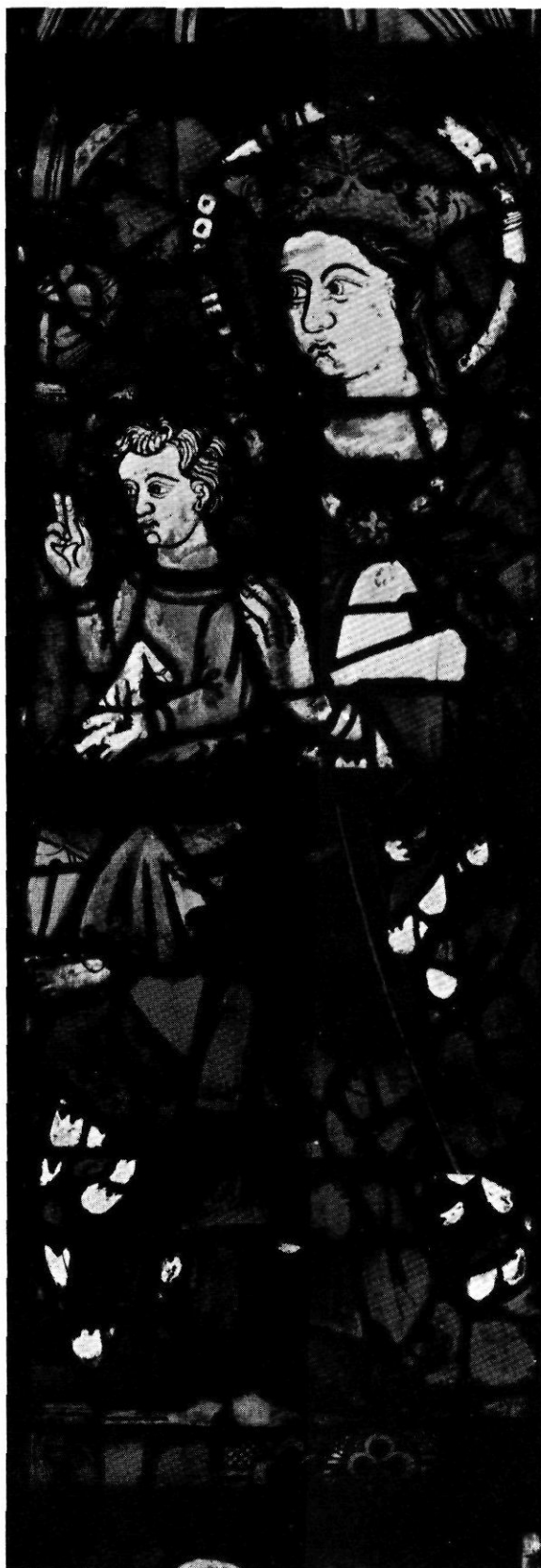
Detall de l'Epifania.

La capella de Santa Magdalena és a la banda Nord del temple i ara té l'advocació de Sant Esteve. L'any 1367 hom construí una mena de porxo o coberta elevada sobre la mateixa capella ja acabada (Obra, l.f. 34-45). L'any 1370 el pintor Guillem Borraçà va pintar la clau de volta que