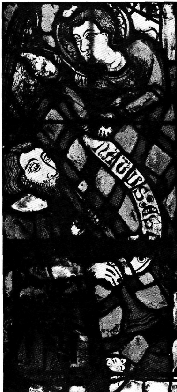
Detall del Naixement de Jesús.

El 16 d'octubre de 1916 un devot va costejar un vitrall per a la capella del baptisteri. Els residus de l'antiga vidriera foren venuts per 300 pessetes.