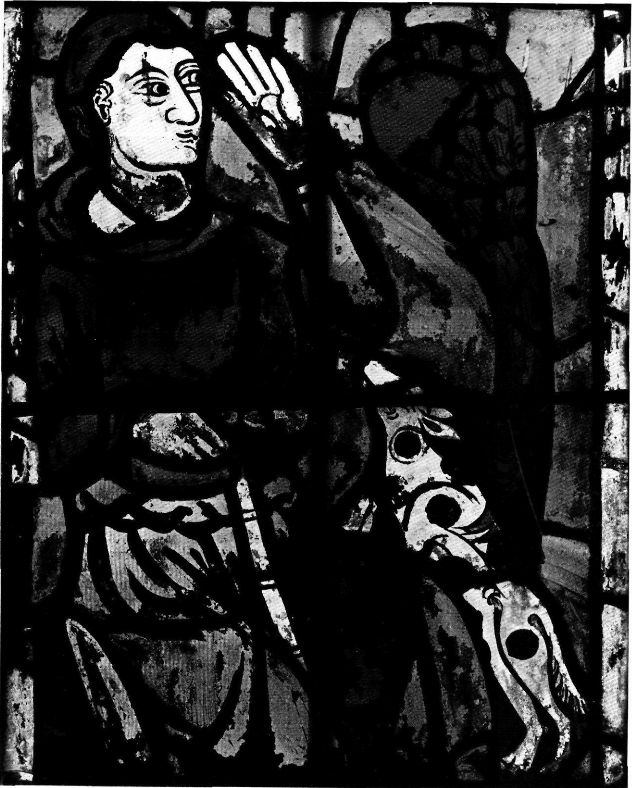
Un pastor en la vidriera del Naixement.

1.º: Sant Pere, amb les claus; Sant Pau, amb l'espasa; Sant Joan, amb un calze; Sant Andreu, amb la creu aspada; 2.º: Sant Jaume, amb bastó de pelegrí; Sant Jaume el menor, amb pergamí; Sant Feliu, amb destral; Sant Bartomeu, amb un ganivet; 3.º: Sant Tomàs, amb una aix-