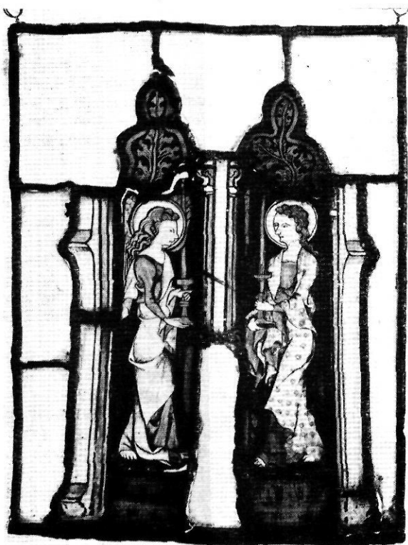
Vitrall del segle XIV, suara recuperat.