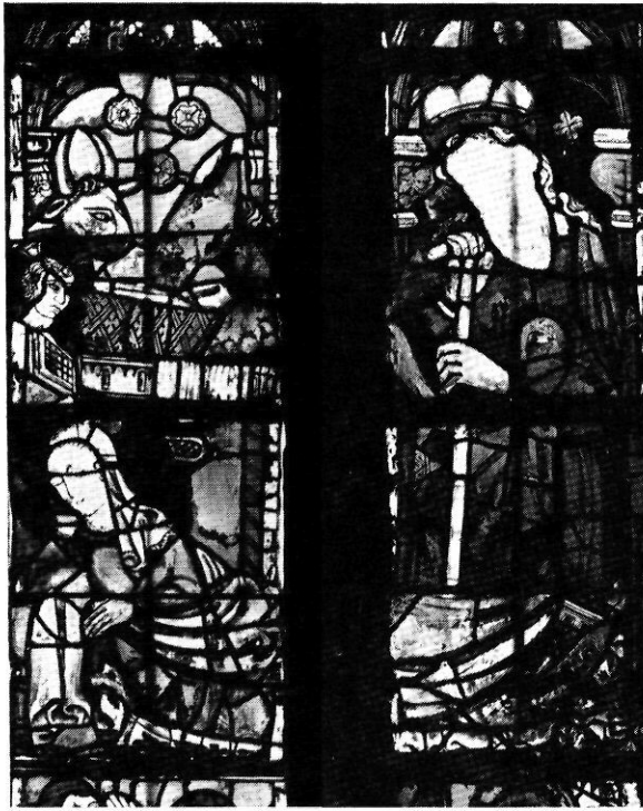
Altre detall del Naixement.

segle catorzè, si bé deu haver estat restaurada més d'un cop.