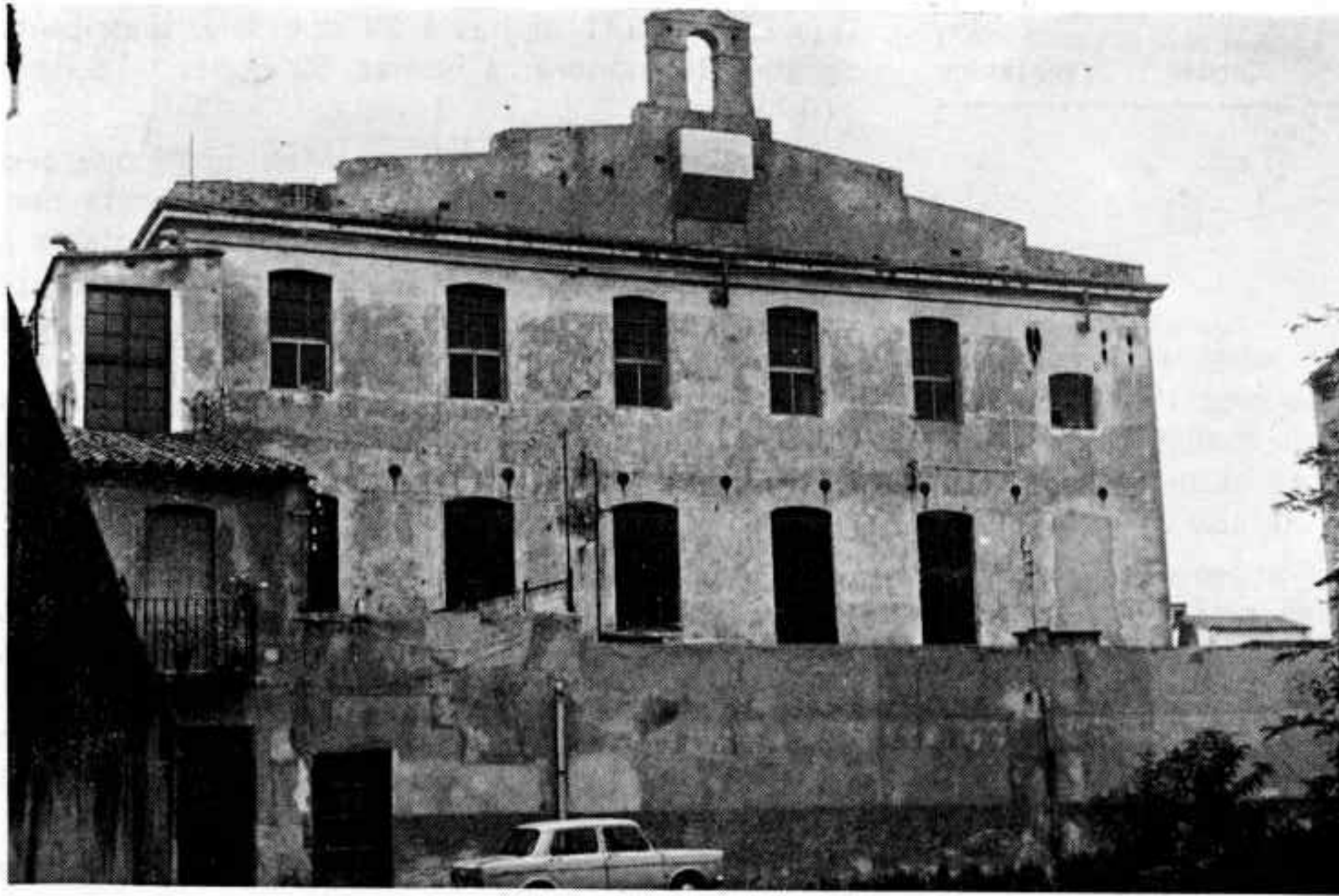
Des del 1979 la fàbrica de Santa Eugènia és regida per la societat "Gerona Textil, S. A.". El 1980 comptava amb 92 treballadors.

i fins i tot a Salt, on hi havia més llocs de treball. El creixement més ràpid es produí en ple segle XX i va ser una conseqüència de l'expansió urbana de la capital.