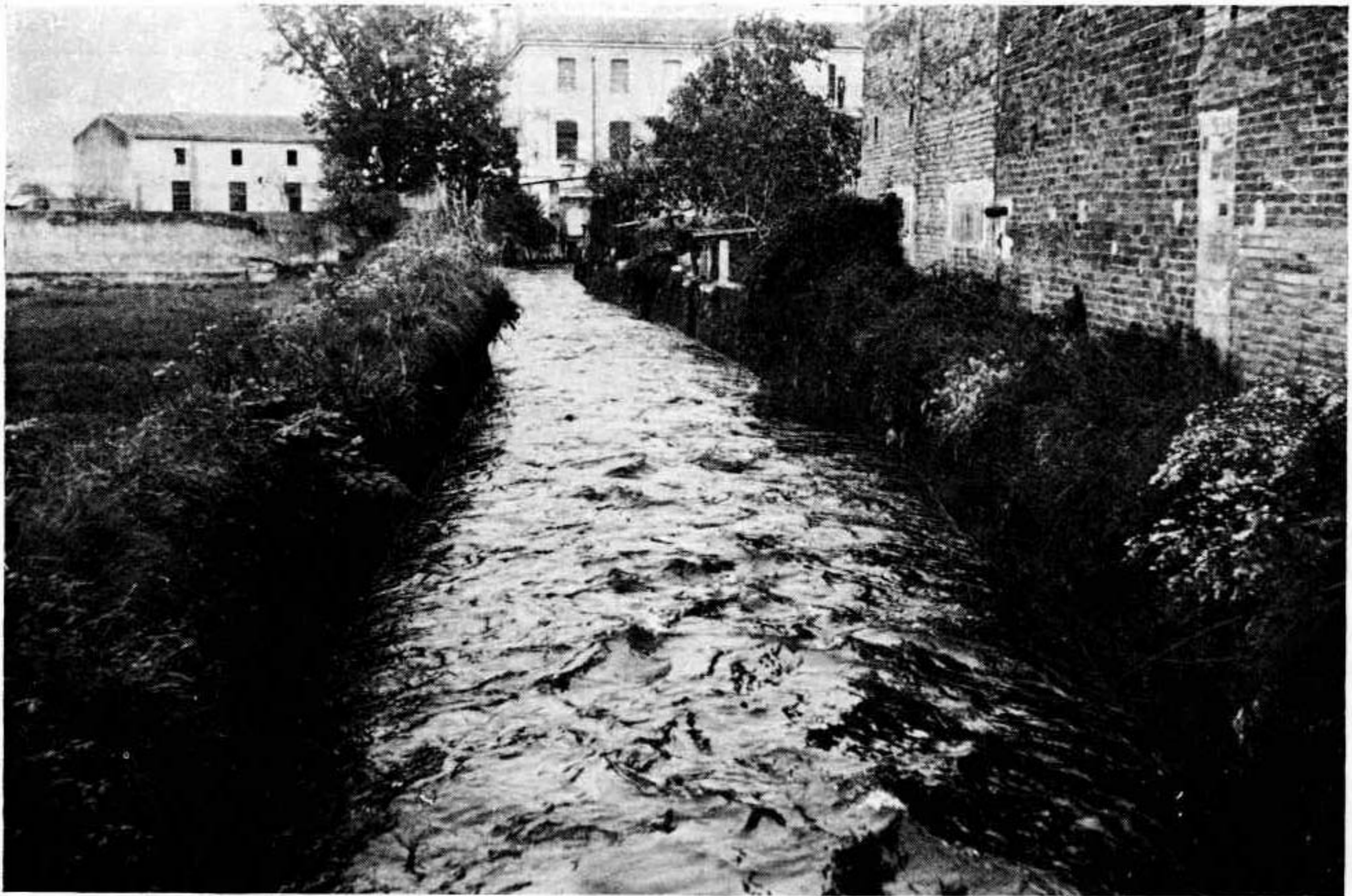
El rec Monar fou un element indispensable per a la industrialització de Salt, Santa Eugènia i Girona. Al fons, la fàbrica de Santa Eugènia.

A hores d'ara, la indústria correspon a la societat «Gerona-Textil, S. A.», la qual des del 1979 és continuadora de l'empresa «Industrial Mataró Gerona, S. A.», i els treballadors que hi són ocupats no arriben a cent.