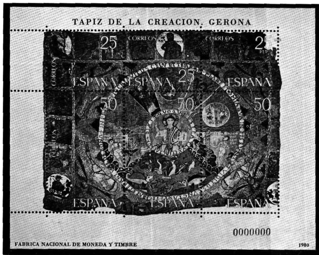
Sèrie de sis segells del Tapís de la Creació, integrats en un bloc-fula (25-10-1980).