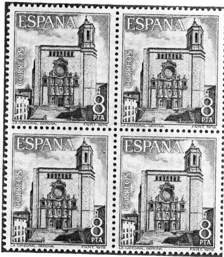
Segell de la Catedral de Girona en "bloc de quatre" (27-6-1979).