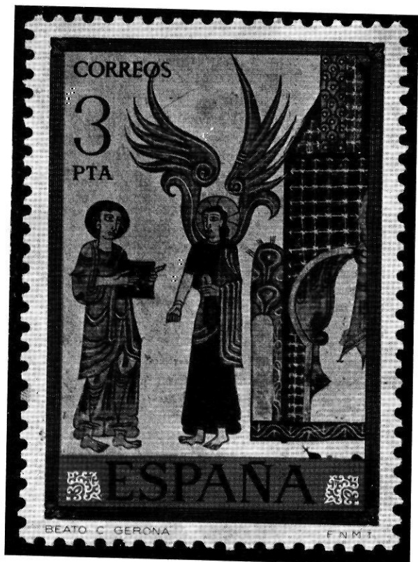
Un dels segells de la sèrie del Mil·lenari del Beatus de Girona (29-9-1975).