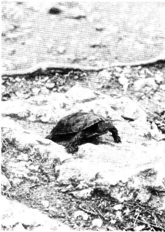
Tortuga d'aigua ( Mauremys caspica ). Foto Ciència i paciència.

La manca de dades referent a algunes espècies en concret, ha fet dubtar de la seva presència en la zona. El dragó rosat ( Hemidactylus turcicus ) presenta una distribució marcadament mediterrània. Martínez Rica (1974) l'assenyala en la franja litoral empordanesa, on ocuparia les pedreres, els espais oberts i assolats, les construccions humanes, etc. L'endemisme ibèric Psammodromus hispanicus que ocuparia terrenys sorrencs amb vegetació halòfila, garriga, etc. I el llagardai verd ( Lacerta viridis ) assenyalat en el departament francès de Cerbere, en el Vallespir (S.H.F., 1978) i també, dubtosament, a Lledó (Alt Empordà).