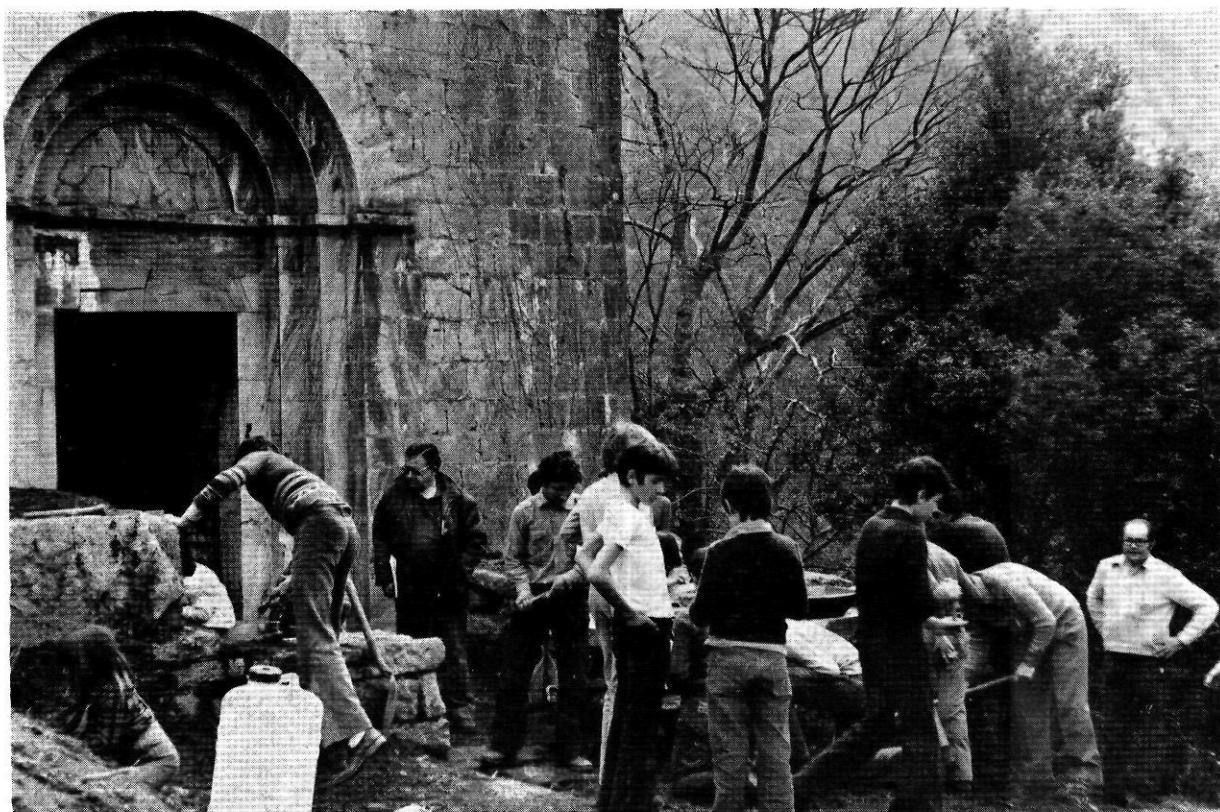
Abril del 1978. Agençament de la placeta que s'obre al davant de la façana de ponent de Sant Feliu de Riu.

bara definitivament salvada, s'iniciaren les obres de recuperació de l'església de Santa Maria d'Escales, un bonic monument amb paraments dels segles XI, XII i XIII, situat en una vall feréstega i reclosa, un xic més avall de l'aiguabarreig de les rieres d'Oix i de Beget. Els treballs consistiren, primordialment, en l'enderrocament d'una sagristia de moderna construcció, adosada a migdia de la nau, en la neteja i agençament de la teulada, en l'eliminació de la vegetació i de les terres portades per les pluges, en el trasllat d'un altar barroc de guix i de pessim gust que amagava l'absis primitiu, en el reforçament d'un arc toral que una figuera havia malmenat en introduir-se les arrels entre els carreus i en deslliurar l'aparellat interior de l'arrebossat, raspallant-lo posteriorment.