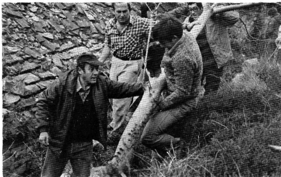
Neteja de l'entorn de Santa Maria d'Escales. Observi's l'estat de la teulada abans de la recuperació del monument.

A més a més de Santa Bàrbara de Pruneres, hom ha dedicat també atenció a altres temples en mal estat de l'Alta Garrotxa. Pel novembre del 1976, quan hom ja considerava Santa Bàr-