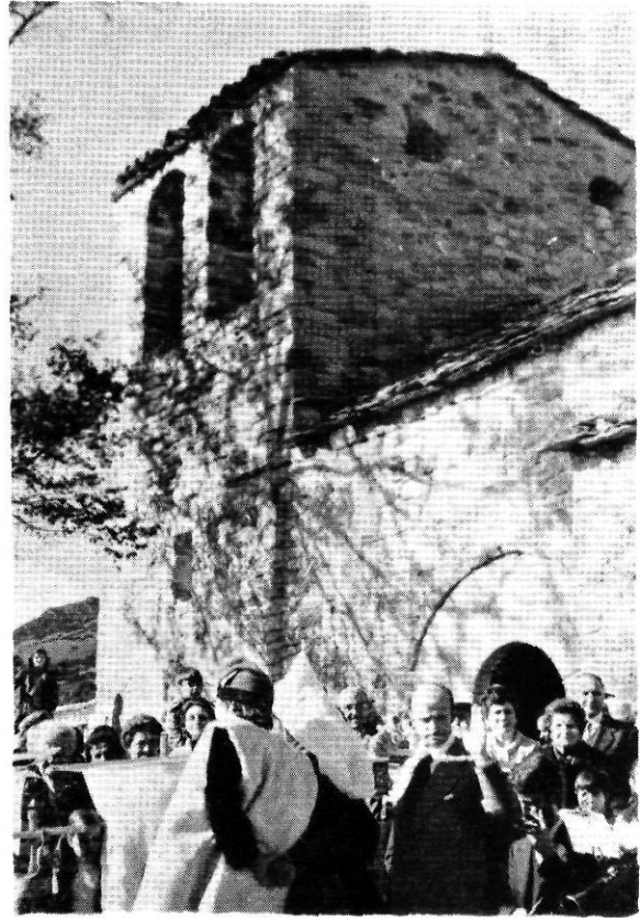
Sant Martí de Surroca, Església romànica. Ballades per la festa davant el temple.

ment, fins que aconseguí escapolar. Però des d'aquella nit ja mai més no es tornaren repetir els incidents provocats per aquell ésser estrany.