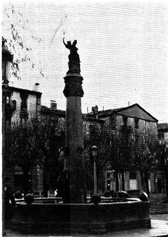
Monument al Comte l'Arnau, a Sant Joan de les Abadesses.

què aquesta joia del Cristianisme tornés a recobrar la seva magnificència i salvar-la de les destrosses sofertes en els daltabaixos que va suportar, l'esperit d'aquell abat insigne hi perdura encara, deixant-nos astorats davant la majestuositat del temple.