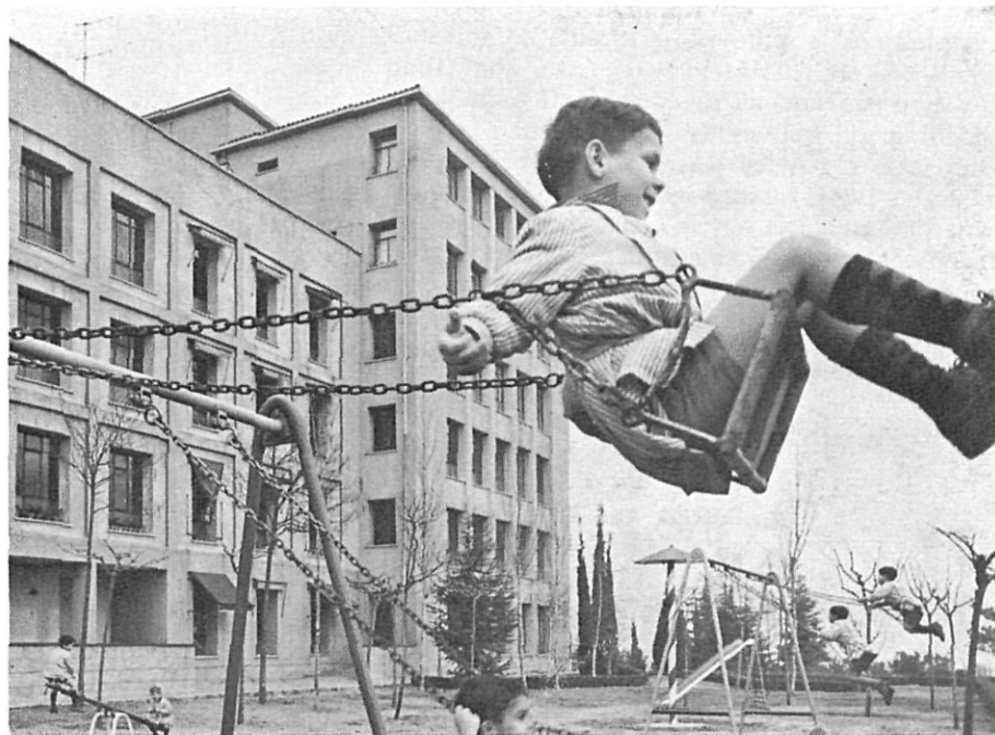
Instal·lacions de l' "Hogar Infantil" de Nostra Senyora de la Misericòrdia en el Puig d'en Roca.