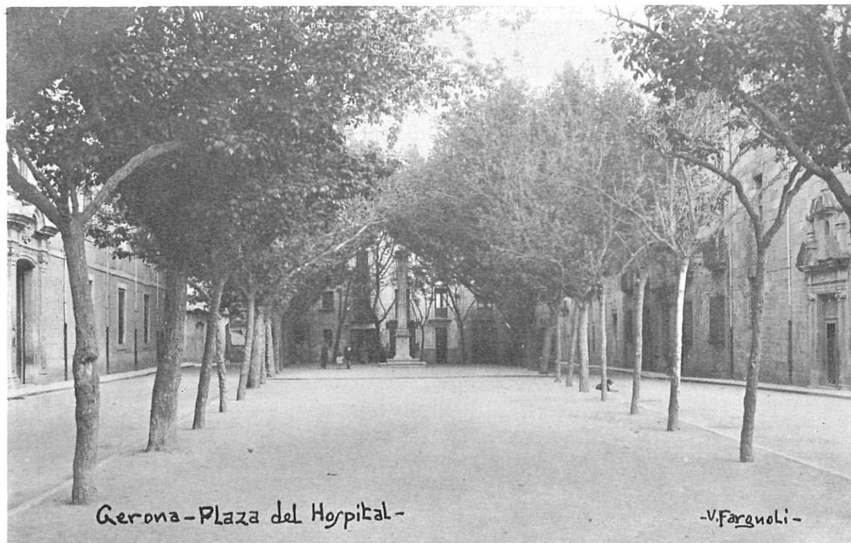
El 1765 fou col·locada la primera pedra de la Casa de Misericòrdia.

Fàbrica material edifici Hospici: 69.763 lliures; 9 sous; 3 diners.