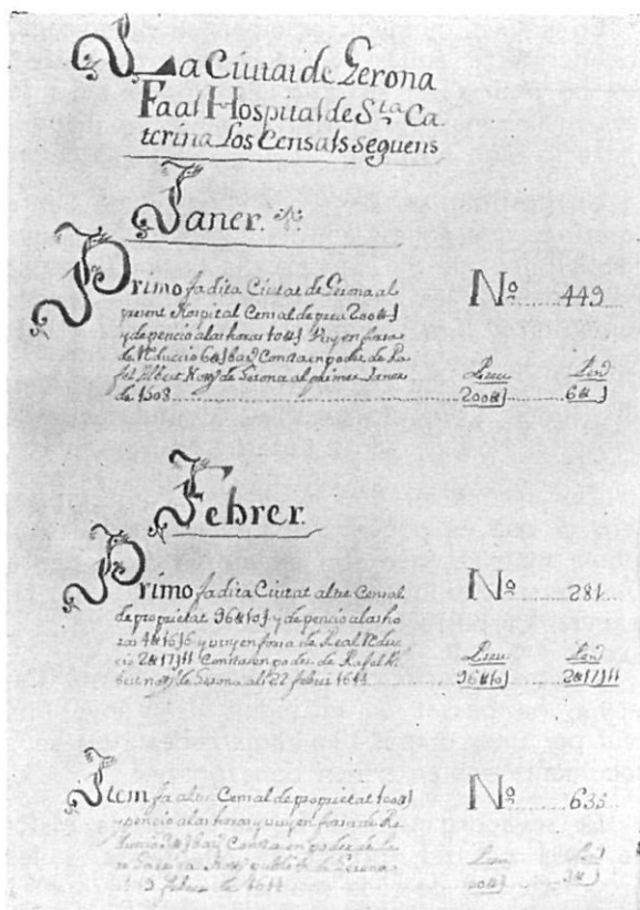
El Procurador cobrava les pensions de censos, censals i altres rendes.

En les mateixes «Ordinacions» de l'any 1706, es senyala el càrrec principal dins l'Hospital, amb el nom de «Prior y Procurador», fent-lo responsable de tota la marxa, tant de l'Administració com dels serveis hospitalaris.