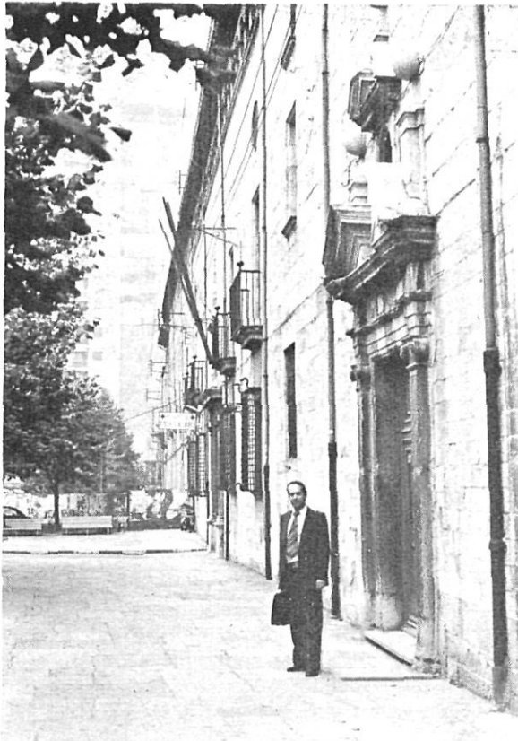
Façana de l'Hospital de Santa Caterina.

rien tingut personalitat jurídica o legal. Llavors era bisbe una destacada personalitat de les nostres comarques que tenia el nom d'Arnau de Creixell, qui va maldar per posar pau entre els homes del seu temps.