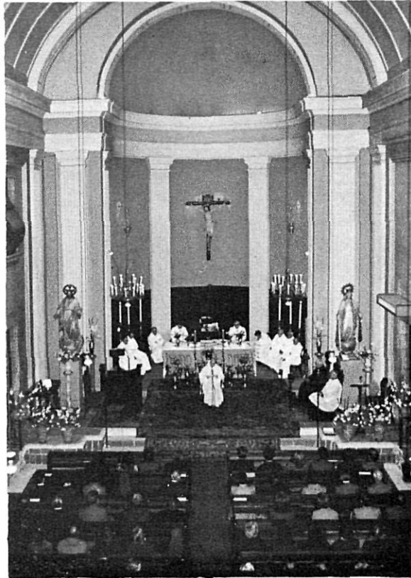
Església de l'Hospital de Santa Caterina.

Uns cent anys més tard, concretament a l'any 1781, el bisbe Tomàs de Lorenzana i Bu-