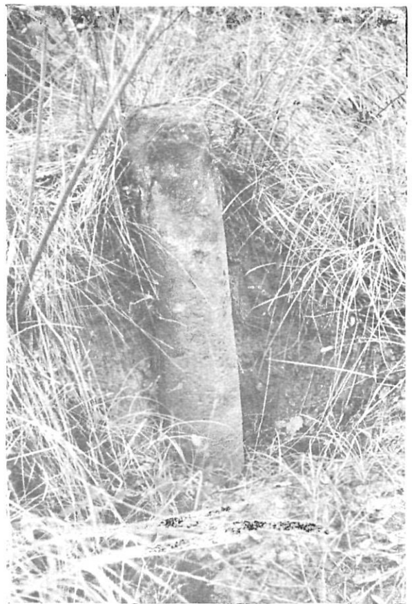
Figura 9. - Mil·liari del "Cami Ral".

Passat Raset, la calçada fa via cap a Cervià de Ter i Medinyà i, passant pel Congost i vorejant el Ter per sota Sant Julià de Ramis, es dirigeix cap a Sarrià de Ter. La via Augusta devia creuar el riu pel pont que hi havia prop de l'indret on es va trobar el milliar i continuava fins a Girona seguint el mateix recorregut que la carretera local del Pont Major a aquesta ciu-