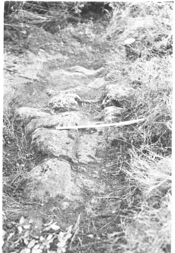
Figura 8. - Detall de les roderes.

Girona. El desgast de l'extrem superior fa impossible de veure-hi cap inscripció; però el Sr. Emili Oliver de Cervià, que és qui el va trobar, creu que hi veié una xifra fa alguns anys. (Fig. 9)