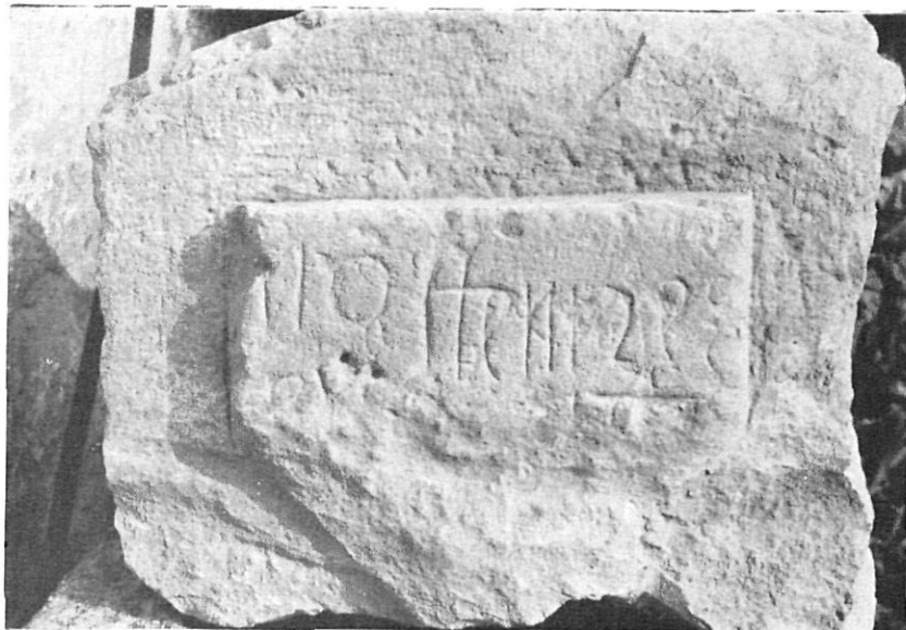
Figura 6. - Pedra amb una inscripció medieval trobada en el punt en què la via troba el riu.

travessava el Fluvià per un pont de pedra, el qual havia servit de pedrera per a construir el monestir romànic que hi ha al poble. D'aquest pont encara se'n veuen restes, mínimes per cert, però que semblen confirmar la seva existència i antiguitat. Nosaltres només hem pogut localitzar tres d'aquests carreus; dos d'ells són mig enterrats pels rierencs, l'altre és dins el riu i cobert d'aigua. Una quarta pedra resta dubtosa, ja que és de factura diferent i porta en un extrem una marca de pedrera, cosa inusual en els carreus dels ponts romans. Fa pocs anys es veien uns vuit carreus, tots ells clavats profundament en el llit del riu. Malauradament tots resten ara enterrats pels còdols arrossegats per les riuades o amagats per les herbes que creixen vora el riu; però en el moment menys esperat poden quedar altra vegada al descobert. (Fig. 5)