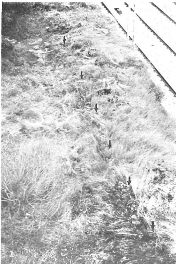
Figura 7. - Una visió del que queda de la via a prop de Sant Mori. Pot veure's la paret que l'envolta i unes roderes (Angle superior esquerra).