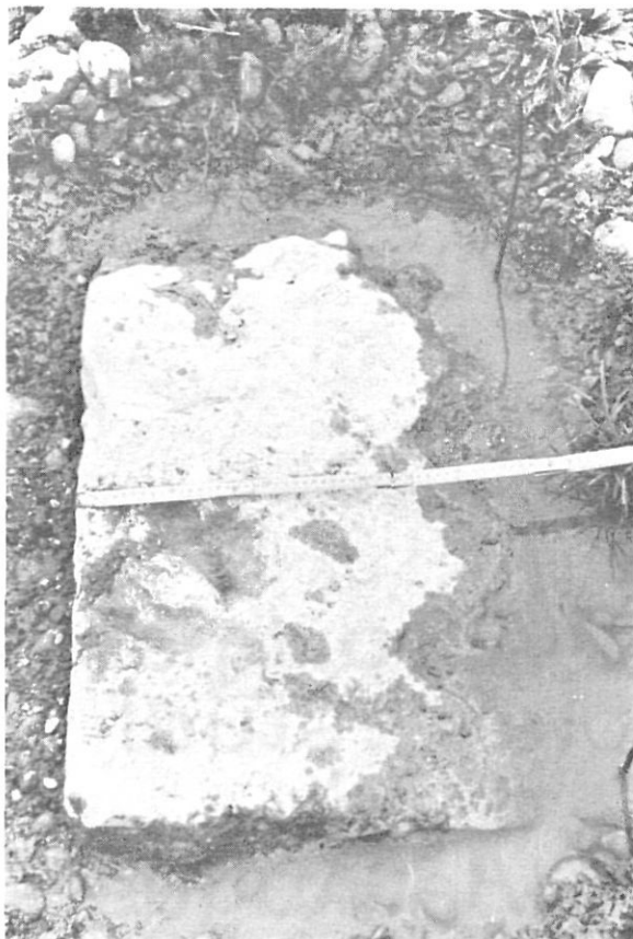
Figura 5. - Un dels carreus del Pont de Sant Miquel de Fluvià, profundament enterrat al llit del riu.

Partint de Narbona, i després de passar per Ruscino, la via anava cap al Summum Pyreneum (el Portús) i seguia cap a Deciana (la Jonque-