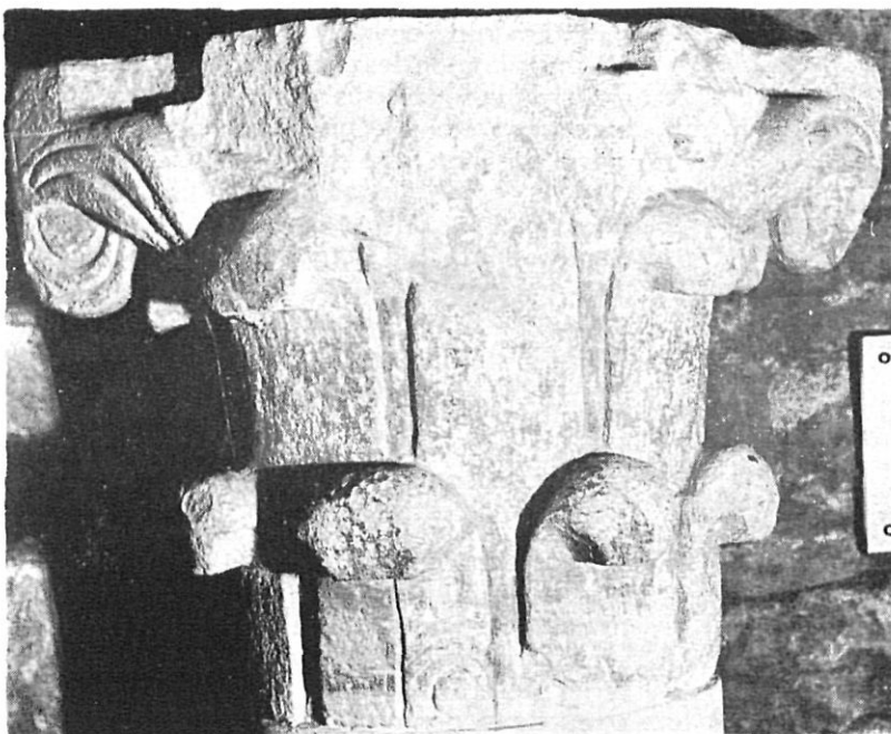
Santa Maria de Ripoll (Ripollès). Capitell del segle X.