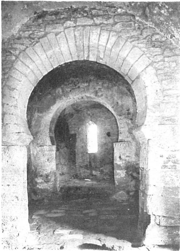
Sant Julià de Boada. (Baix Empordà). Interior. Segle X.

La Porta Ferrada és un petit fragment arquitectònic del primitiu cenobi guixolenc, escriu J. Badia ( L'Arquitectura Medieval de l'Empordà . Girona, 1977), per a definir i situar el mur amb arcades que s'aixeca davant la façana de l'actual església, la funció original del qual ens és impossible de precisar amb seguretat, tot i les excavacions i restauracions que s'han dut a terme en els darrers temps. En conseqüència, l'estudi d'aquest tema sols pot ésser contemplat des de la hipòtesi, la qual esdevé dramàtica per causa del dubte que des del primer instant envolta el caràcter i utilitat primitius de la Porta Ferrada. En aquest sentit caldrà esperar noves treballs documentals i/o constatar els resultats de futures excavacions.