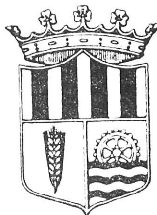
Escut de Salt aprovat el 1950.