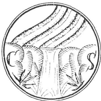
Escut del Casal Saltenc, inspirat en un altre d'anterior concebut pels mestres Moreno (pare i fill).

Ens inclinem a pensar que el nom del nostre poble deriva d'un mot llatí simple — Sal-tum —, per bé que no necessàriament ha de significar salt d'aigua o catarata, puix que també admet altres traduccions com bosc, gorja, estret i pot ser una mesura de superfície.