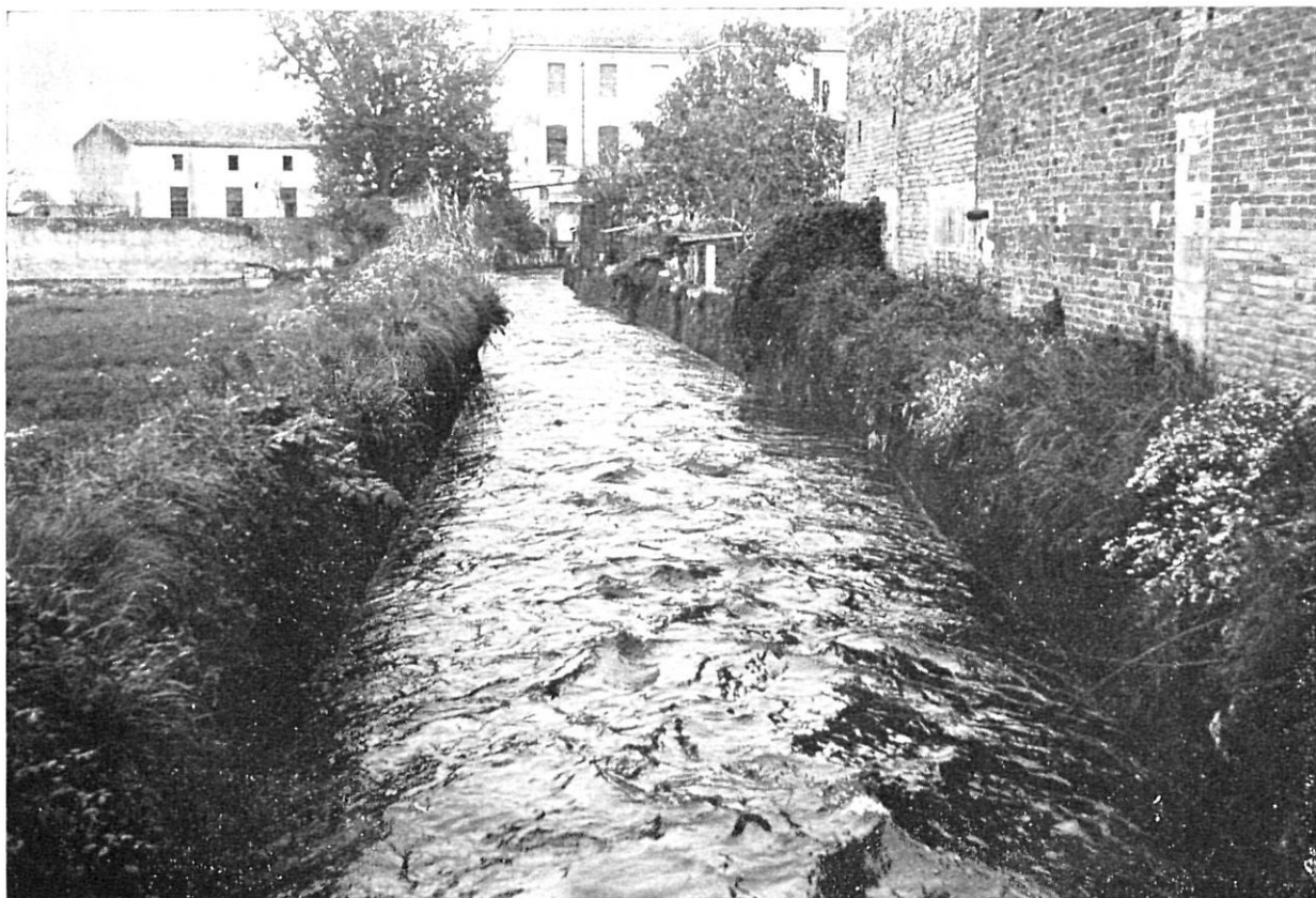
El rec Monar: un element indispensable per a la industrialització de Salt, Santa Eugènia i Girona.

Pel que fa a la jurisdicció, aquest mateix autor posa de manifest que la reial suplantà l'eclésiàstica i senyorial en el transcurs del segle XIV al XVI. Sobrequés havia consignat que al segle XV, Salt pertanyia als Vern, ciutadans de Girona.