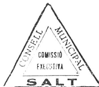
Segell del Consell Municipal constituït el 1936.