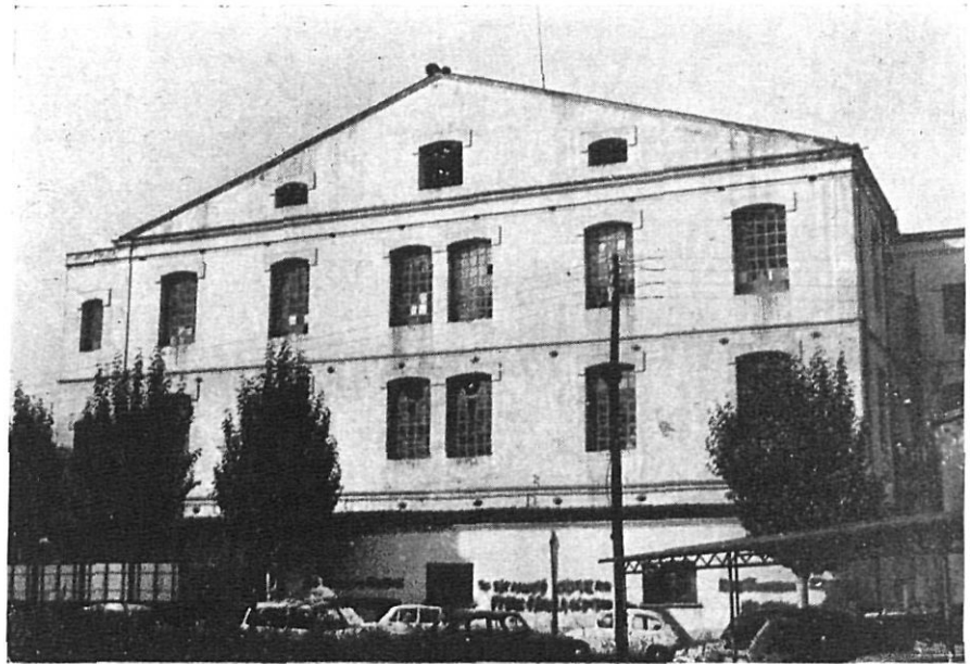
Vista parcial de l'actual "Sucesora de J. Coma i Cros" amb pintades a les parets.

justícia, llibertat i igualtat, i que acollien amb bons ulls la idea republicana federal, com ho prova el fet que el 1869 un grup de saltencs s'incorporés a la insurrecció republicana, sota les ordres del diputat banyolí, Josep T. d'Ameller.