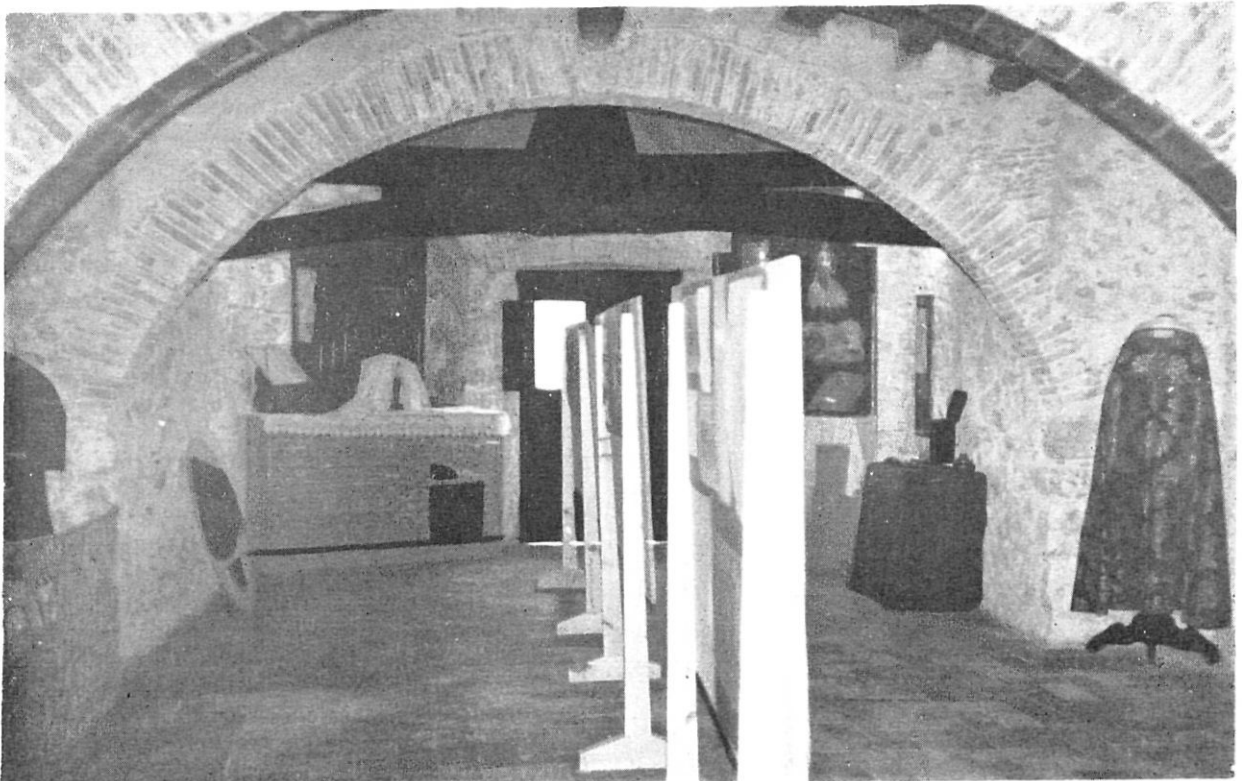
Detall del petit Museu de Calonge