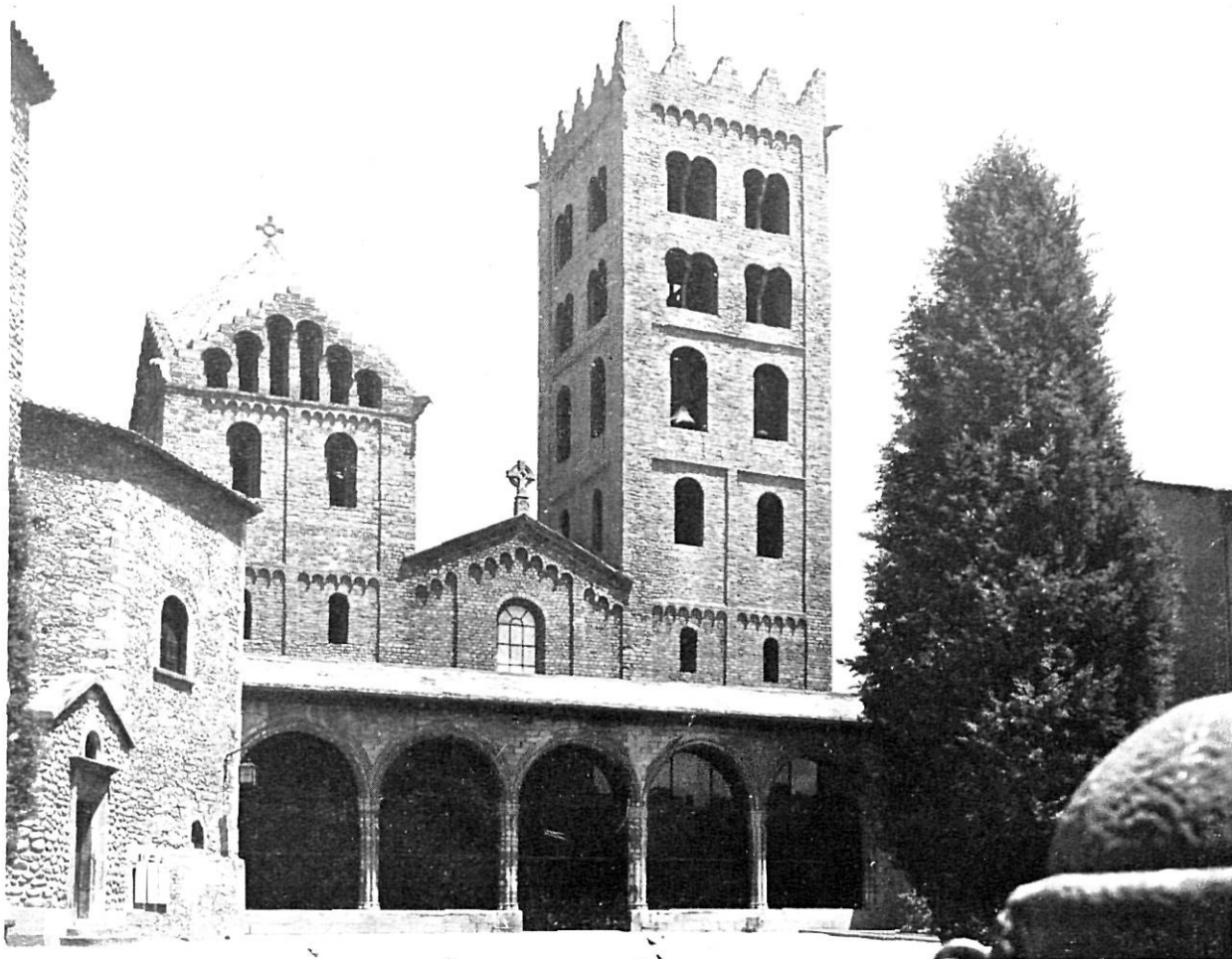
Es evident que a Ripoll es va voler fer un gran edifici que recordés el centre de l'espiritualitat del món.