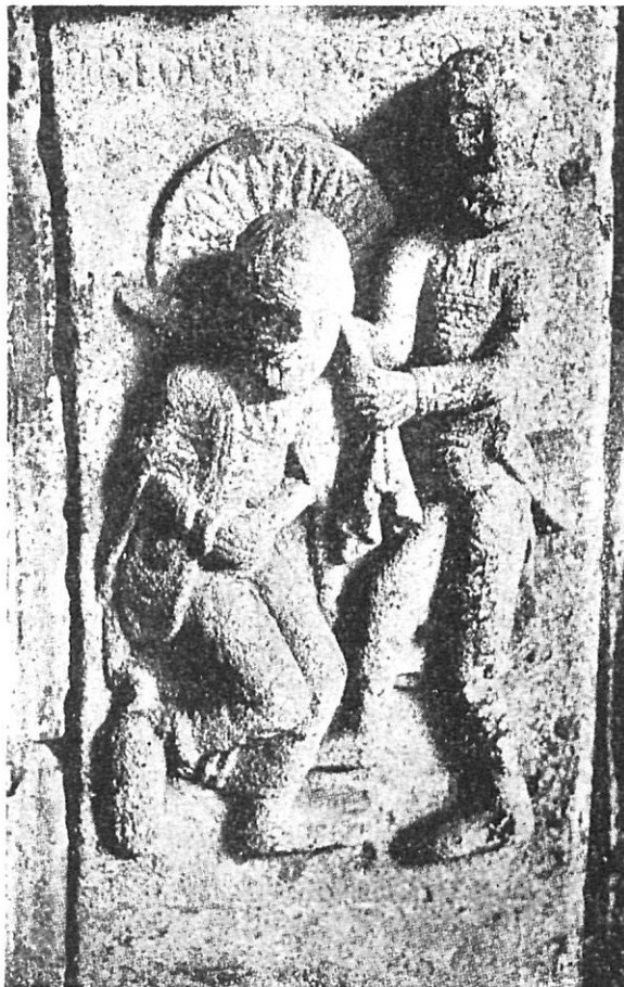
Ripoll. - Decapitació de Sant Pau.