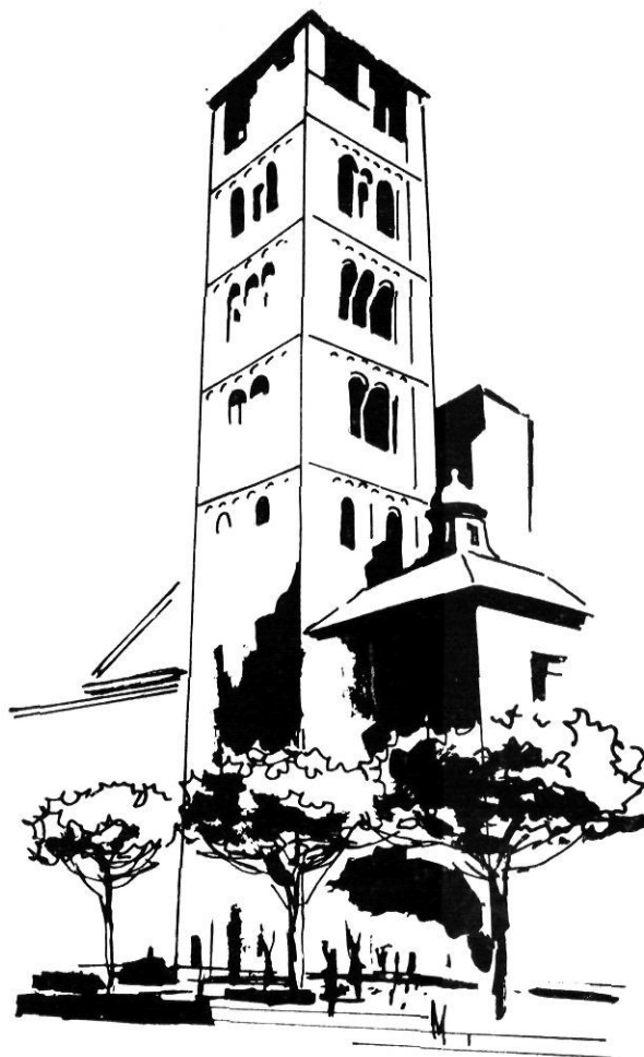
Aspecte monumental de Vic, centre de la comarca estudiada per Gonçal de Reparaz (fill).

Editorial Barcino , en poc temps i mentre prepara la Geografia general de Catalunya, València i Balears, ha posat al mercat, pulcra-