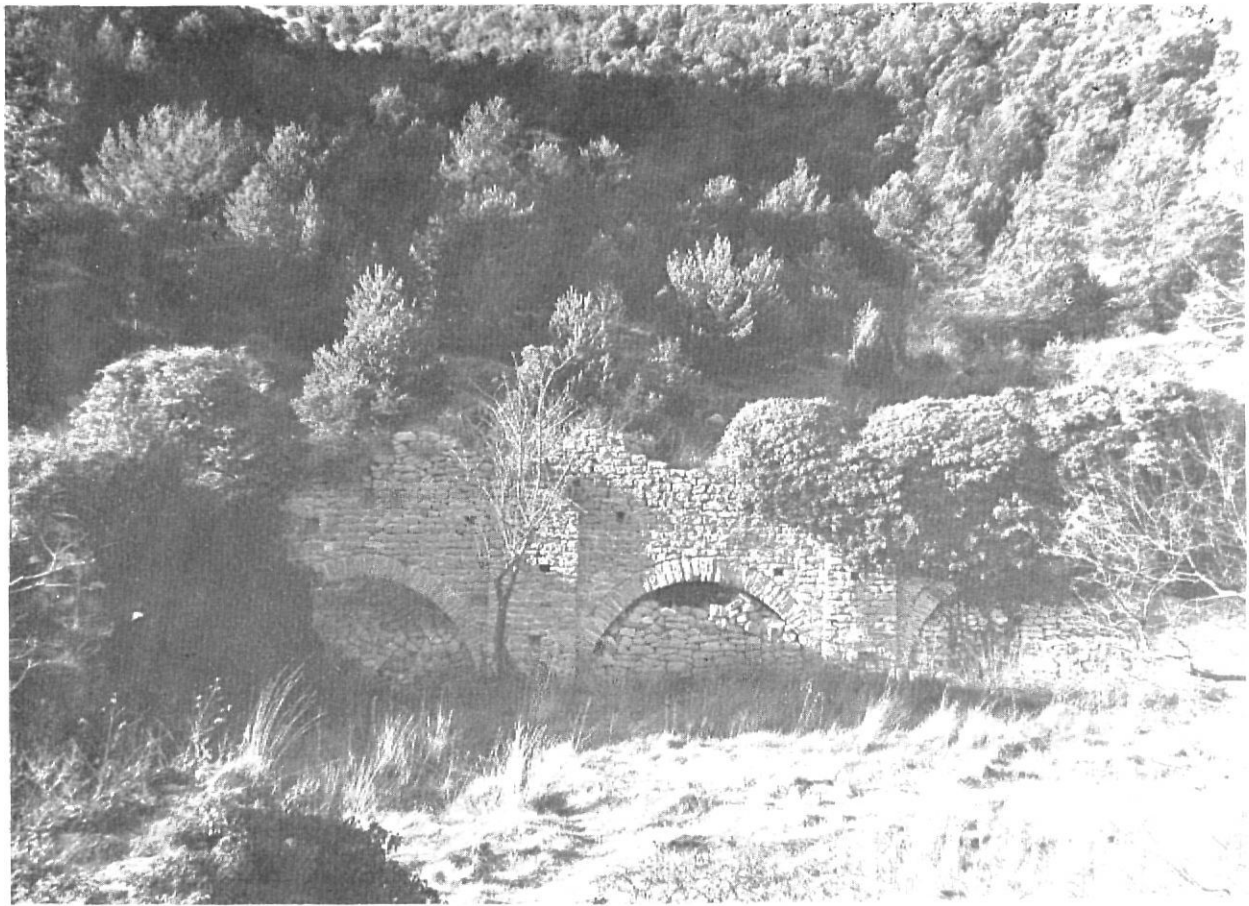
Sant Llorenç de Sous. - Alta Garrotxa. La situació en què es troba actualment el nostre patrimoni arquitectònic reclama amb promptitud una acció responsable per tal d'aturar el seu empobriment i la seva degradació.

El Comitè executiu del Consell Internacional de Monuments i Sitis, I.C.O.M.O.S., decidí celebrar el mes de setembre passat el congrés regional d'aquest organisme no-governamental a la República Democràtica Alemanya el tema central del qual fou la «Participació de la joventut en la conservació i revalorització dels centres històrics de les ciutats». Amb l'intenció d'experimentar l'intercanvi de coneixement vaig tenir l'oportunitat de concórrer-hi i de comprovar alhora les diferències i deficiències que exterioritza l'actitud gairebé generalitzada de despreocupació que en aquest camp hom ha seguit en el nostre país al llarg dels darrers temps. La situació en què es troba actualment el nostre patrimoni arquitectònic i paisatgístic reclama amb promptitud una acció responsable per tal d'aturar el seu empobriment i la seva degradació. En aquest sentit és evident que el concurs de la joventut traspasant els diferents nivells de l'ensenyament pot tenir una transcendència insospitada. Així ho ha expressat l'U.N.E.S.C.O. i també l'I.C.O.M.O.S. el qual en el moment d'estructurar la conferència re-