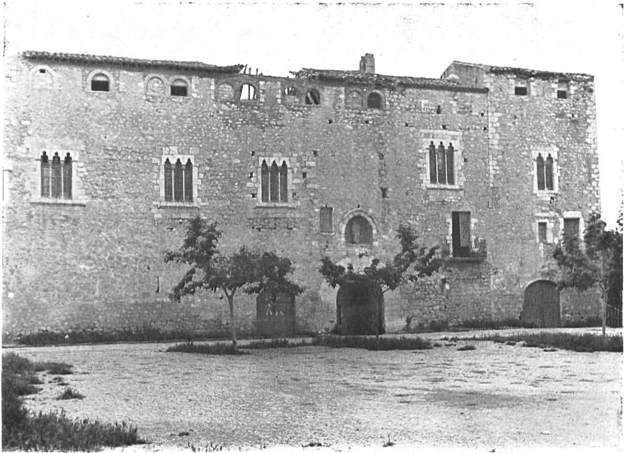
Vilabertran, palau prioral. Alt Empordà. - Es precis i amb urgència fixar un programa d'actuació el qual s'ha de fonamentar sobre les premisses d'una restauració amb majúscula.

i de les velles poblacions del medi rural, ens permeten conèixer les relacions entre la funció que tenien en el moment de la seva creació i les solucions tècniques i artístiques que els seus creadors buscàren d'aplicar-hi. Reconèixer la lluita de l'home en crear formes sempre més perfeccionades i sempre més reeixides en benefici propi, dels conciutadans i de les futures generacions, ha d'entusiasmar i estimular, particularment a la joventut, a executar les seves pròpies creacions. D'altra banda, la comprensió de l'heretatge cultural reforça l'estima pel país i si aquest sentiment d'estimació és inculcat al llarg d'un programa d'ensenyament, és clar que ha de conduir a observar un respecte profund envers les realitzacions històriques i contemporànies que el propi poble i d'altres han acomplert en el transcurs del desenvolupament de l'humanitat.