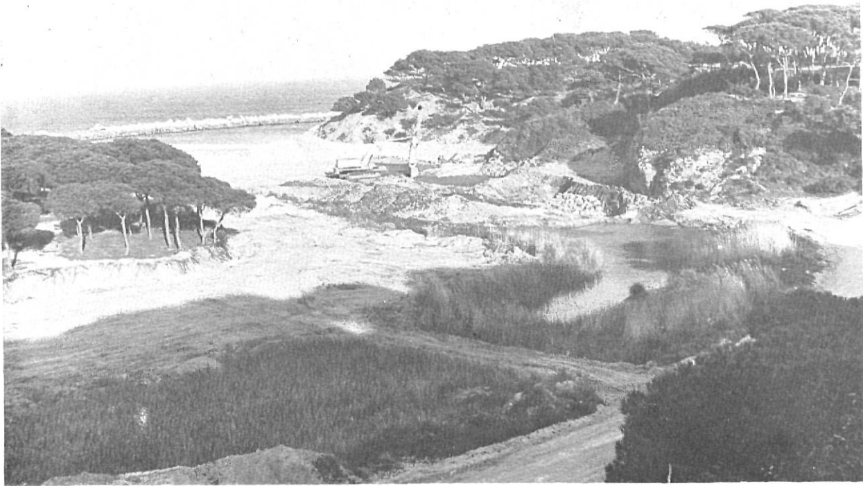
Punta Prima. Platja d'Aro. - Baix Empordà. La consideració a la topografia i a la protecció del medi ambient ha d'ésser en tot moment garantia indispensable en qualsevol tipus de desenvolupament urbanístic.

En aquest sentit cal remarcar el programa de revitalització de la petita ciutat jugoslava de Groznjan que ha portat a cap recentment l'Institut d'Història de l'Art de la Universitat de Zagreb. Com moltes poblacions de les nostres contrades, Groznjan havia vist fugir els seus habitants cap als centres industrials veïns, restant pràcticament buida amb tot el que comportava de degradació i pèrdua irreparable de la seva vitalitat i del seu patrimoni arquitectònic. Els punts essencials del projecte-pilot per a la revitalització l'aplicació dels quals han retornat la vida a Groznjan han estat, en síntesi, la reanimació de la població sobre les bases de mantenir l'autenticitat de l'ambient físic, històric i cultural de la ciutat, suscitant al mateix temps l'interès de la joventut per a augmentar el treball socialment útil i per a desenvolupar el canvi de productes. En definitiva, el programa ha consistit en donar a la ciutat l'arranjament mínim per tal que pugui reintegrar-se al corrent de la vida moderna amb les seves pròpies forces.