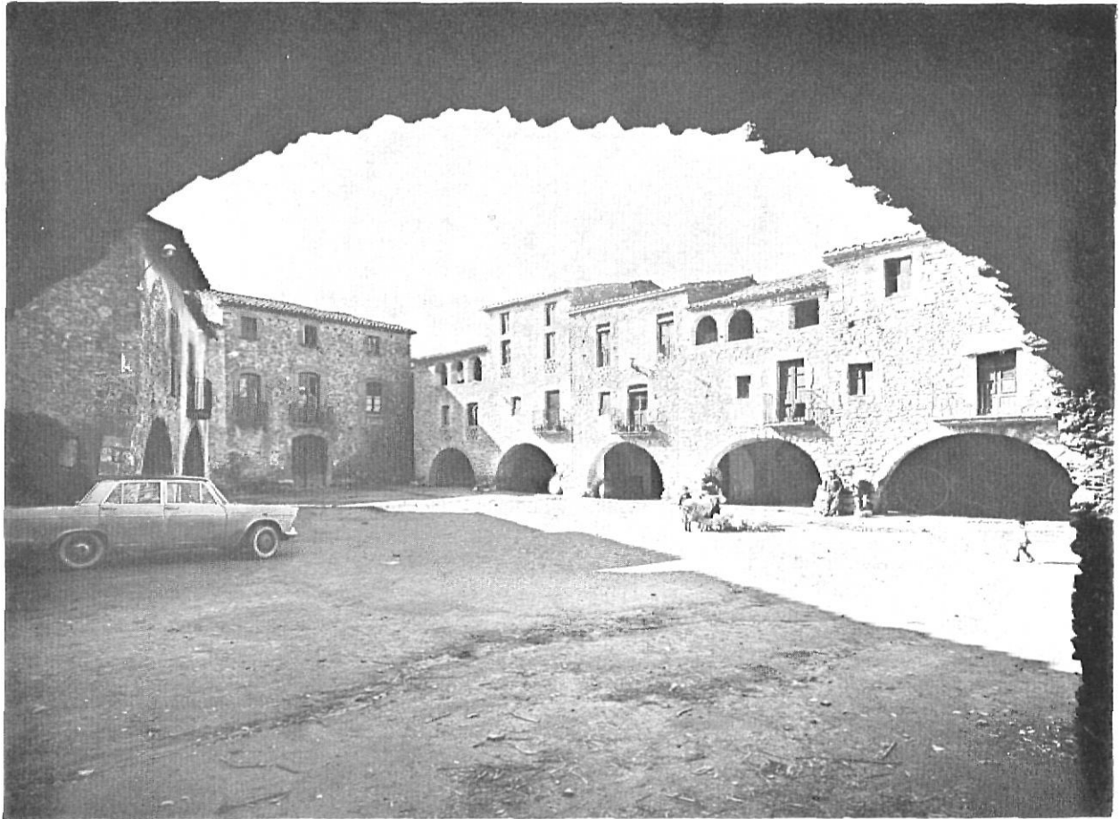
Monells, plaça. Baix Empordà. - Hom ha de tendir no solament al desenvolupament del nivell econòmic de vida, sinó també a establir la protecció de l'ambient de vida.

la creació de zones únicament per a viannants, hom ha d'oferir un camp de dinamisme i d'esplai a tots els ciutadans en general i a la joventut en particular, amb la finalitat d'assegurar el seu concurs actiu i la seva preocupació pel futur dels llocs històrics, de la mateixa manera que des de fa una colla d'anys la participació d'estudiants i post-graduats en les excavacions arqueològiques garanteix la continuïtat i ampliació d'aquest tipus de recerques.