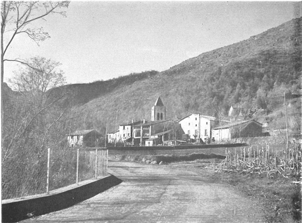
L'ecologia no deu trencar-se de com la conserven a Sant Privat de Bas.

de la promulgació de la Llei del 13 de maig de 1933 els intents en custodiar el llegat cultural, les belleses naturals i els sistemes ecològics s'han limitat en l'aspecte jurídic a la Llei del 12 de maig de 1956 i a pocs Decrets de declaració d'uns llocs o paratges determinats. Aquest «corpus» vertaderament exigü conté d'altra banda, sensibles deficiències tan des del punt de vista quantitatiu perquè l'inventari no és complet, com del qualitatiu perquè la normativa és extremadament ambigua. A més, la mateixa organització administrativa que té cura de vetllar pel seu compliment sovint es troba subjugada en situacions conflictives i a voltes anacròniques per causa dels equívocs que l'esmentada legislació posseeix. Alguns fets ocorreguts recentment a les nostres comarques en són exemples ben significatius i prou coneguts per no haver-ne de reiterar el seu comentari.