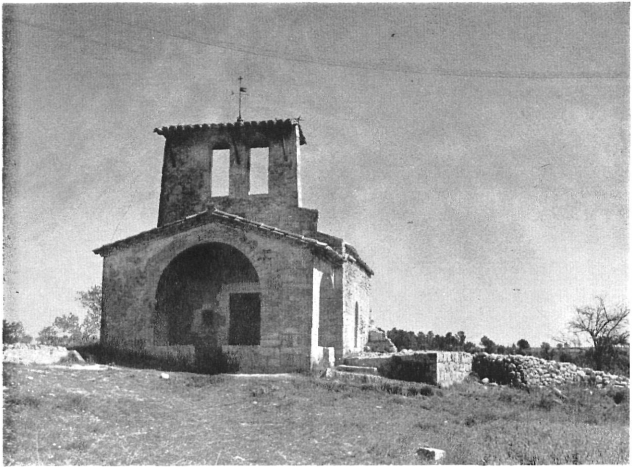
Església de Fontcuberta,

«paisatge-quadre» que s'ha apoiat la legislació espanyola que fa referència a la protecció i ordenació del patrimoni natural i artístic. Hom pot afirmar que ens trobem davant un exemple clar d'anacronisme doncs mentre en el camp de l'estètica i de les arts figuratives s'operà a Europa una forta transformació des de les darreries del segle passat, paral·lela al desenvolupament econòmic i social, avui i aquí encara és vigent un ordenament jurídic que ha oblidat les necessitats d'una societat en constant evolució.