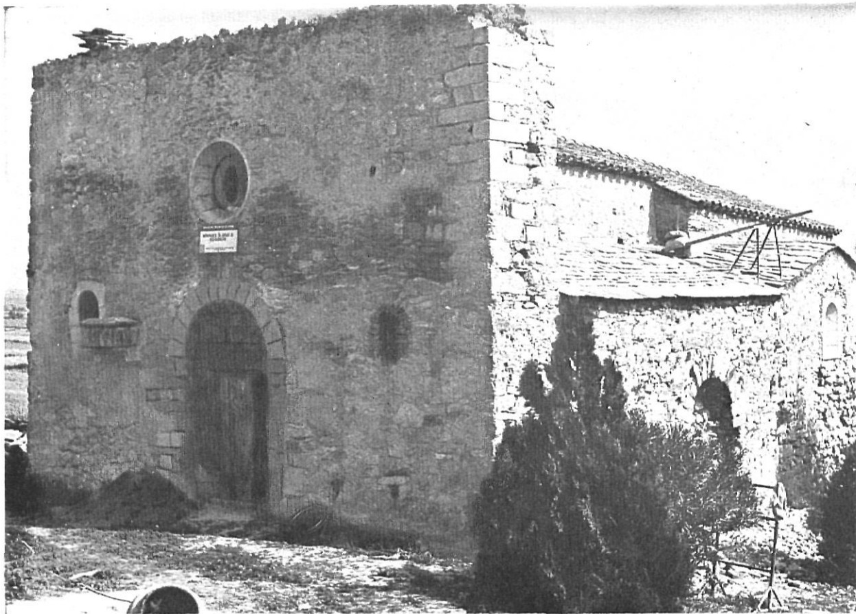
Restauració de l'església romànica de Sant Joan de Bellcaire.

els enfonsa en l'oblit i en l'aïllament més absoluts.