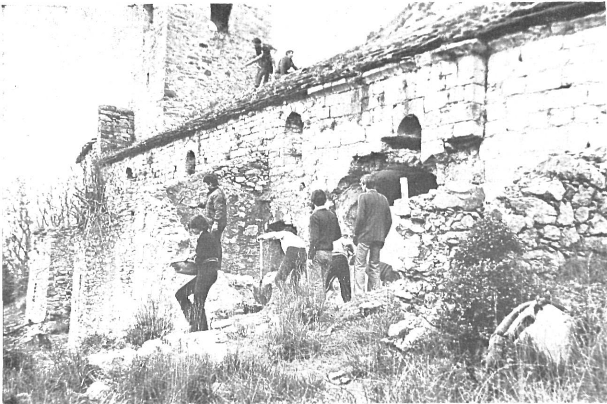
Santa Maria d'Escales. Alta Garrotxa. - Hom ha d'ofrir un camp de dinamisme i d'esplai a tots els ciutadans en general i a la joventut en particular, amb la finalitat d'assegurar el seu concurs actiu.

dels centres històrics, eliminar velles deformacions, impedir-ne de noves, i restaurar sistemàticament les zones i edificis que en tinguin necessitat. Això suposa previament fer anàlisis sobre un Pla d'Urbanització i aplicar els mètodes de la conservació de monuments.