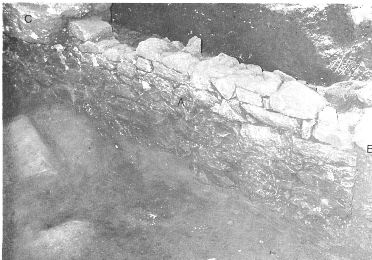
Girona. - Institut Vell. Detall del mur A.