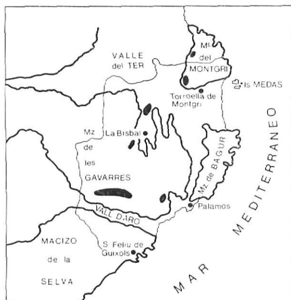
1 Esquema del Baix Empordà, lugar de la zona litoral donde se ha efectuado principalmente el estudio colonial (las colonias señaladas).

En el término de BellHloch, a unos 8 Kms. de Santa Cristina de Aro, se encuentra emplazada otra colonia de esta especie. Se halla situada por un pequeño espacio de terreno, resultante del abandono de la antigua vía del