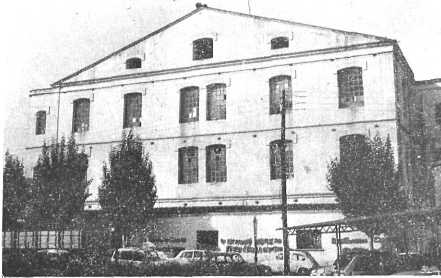
La fàbrica "Coma i Cros" de's nostres dies, com les fàbriques del s. XIX, compta amb una bona colla de treballadors no nascuts a Salt.