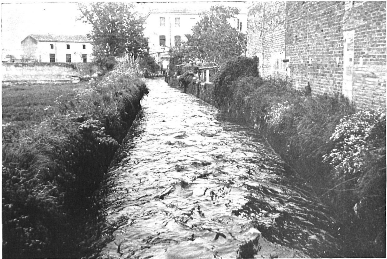
La sèquia Monar fou un element importantíssim per a la industrialització de Salt, Santa Eugènia i Girona.