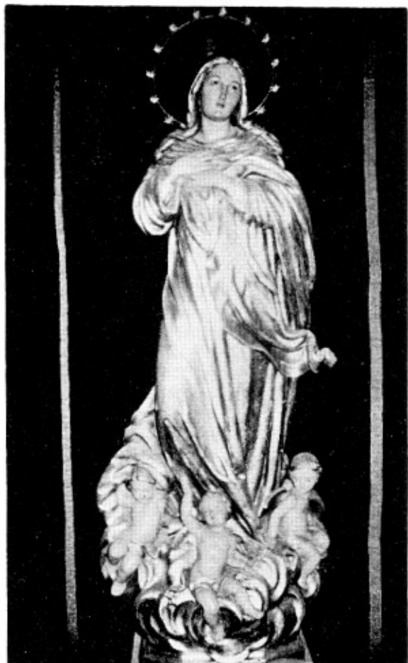
Imagen de la Purísima en la Catedral, imitación de la que fue donada por el Obispo Sivilla. Se venera en la Iglesia Catedral.

Podem descriure, doncs, així l'evolució de la clerecia gironina al darrer quart de segle; durant els cinc primers anys de la restauració hom reorganitza els quadres; al disseny següent desapareix per llei biològica el grup que recorda encara els episodis de 1835, és a dir, l'ensulsiada de l'església de l'Antic Règim, que si bé portà elements dinamitzadors amb l'exclaustració (el dominic Planas, l'agustí Aymerich), també es defineix per un enyor excessiu de l'aliança entre el tron i l'altar; finalment, al darrer disseny el cos clerical es rejuveneix amb generacions molt nombroses de personal format totalment dintre el clima de la restauració.