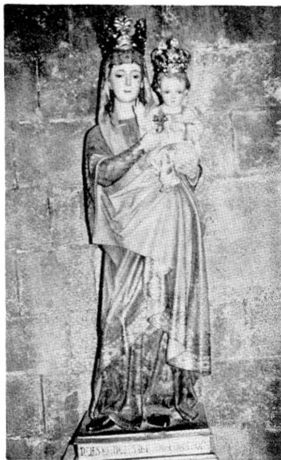
Imagen de Nuestra Señora del Sagrado Corazón en la Seo.