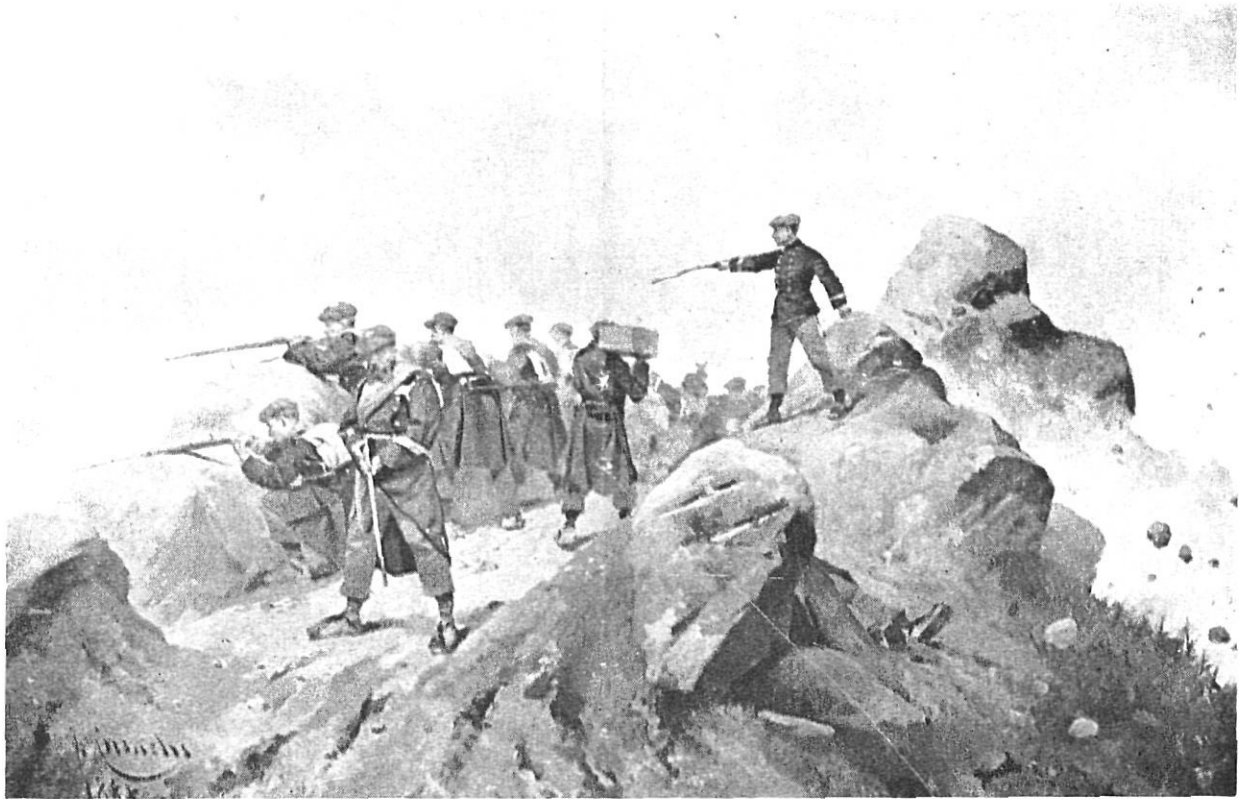
"La Trinchera", obra de J. Cusachs.

terament, fredament i prescindint de la duresa de l'impacte. A Ripoll (7 d'abril), a Caldetes (21 d'abril), a Palau Tordera (23 d'abril), a Sta. Coloma de Farners (25 d'abril), a Blanes (2 de juny), a Prats de Lluçanès (6 de juliol), entre Figueres i la Jonquera (6 de juliol), a Breda (1 d'agost) i així podem seguir i àdhuc repetir-nos en els mateixos indrets amb d'altres escaramusses i enfrontaments bèl·lics.