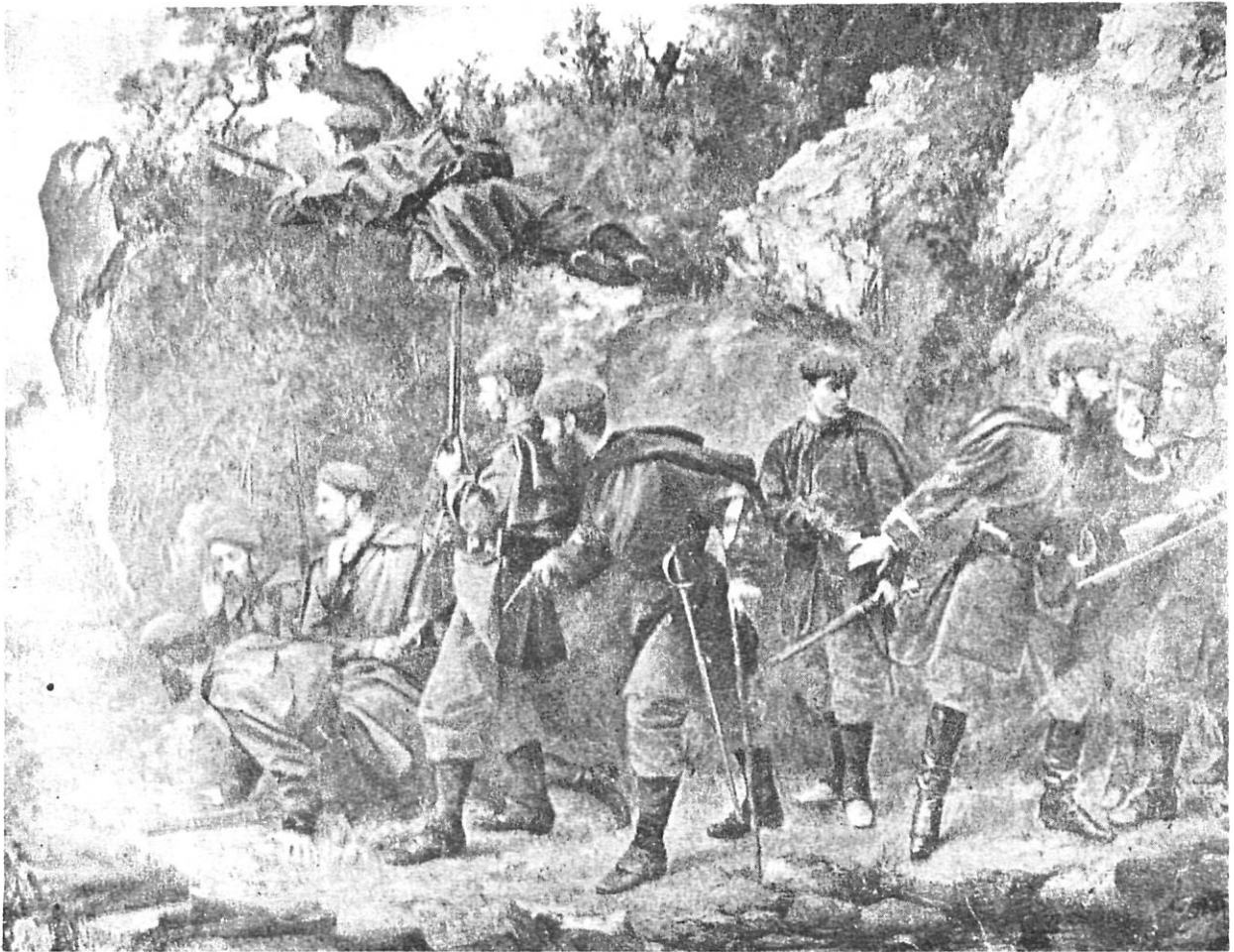
"Emboscada", obra de Josep Benlliure (col·lecció Gassió).

quietessin les columnes enemigues, les quals, implacablement, acorralaven el carlisme als reductes geogràfics més inexpugnables.