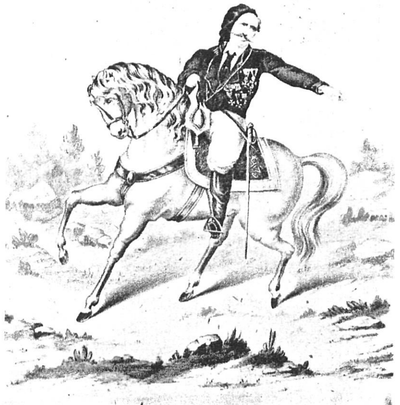
Francesc Savalls i Massot, segons un gravat de l'època.

Aquests mesos, en Savalls i els altres militars a les seves ordres, al cap de llurs batallons i companyies, lluitaren sense que s'entengui massa l'estratègia. Les expedicions, almenys en aparença, mai no s'aplicaven al servei d'una acció militar de conjunt amb tàctiques que in-