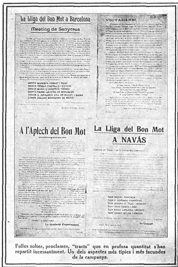
Fulles soltes, proclames, "tracts" que en profusa quantitat s'han repartit incessantment. Un dels aspectes més típics i més fecundes de la campanya.