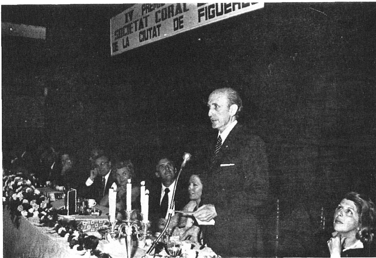
El Presidente de la Sociedad Erato, de Figueras, organizador del Certamen durante el acto.

conjunción de aspectos que abarca, ya que, dejando siempre en el eje y centro la finalidad para que fueron creados, en torno a ellos se reúnen diversas fuerzas vivas, conjuntadas en esta doble versión humana de lo espiritual y lo económico.