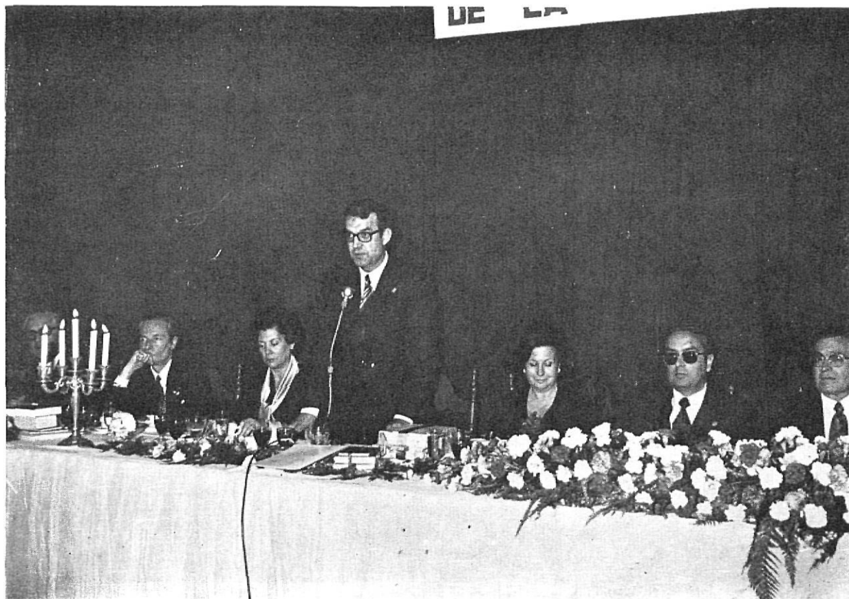
El alcalde de Figueras dirigiéndose a los presentes en el acto de entrega de los Premios Literarios.

del Jurado calificador de cada una de las modalidades, prescindiendo de la fiesta social que tenía lugar en el Teatro Municipal, dentro los actos de las Ferias y Fiestas de Gerona.