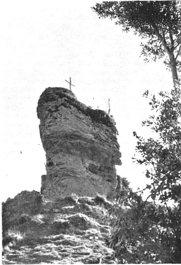
Rocacorba tiene ya carretera de acceso, que había de ser previa para la instalación de un repetidor de TV. Pero éste se ha diferido. Un buen atasco, televisado en directo.