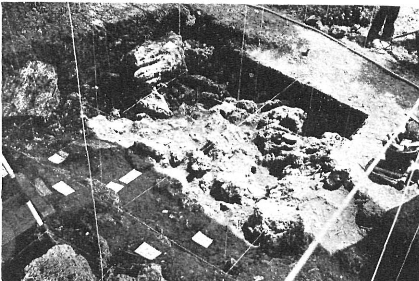
L'Arbreda. - El primer nivell de grans blocs.