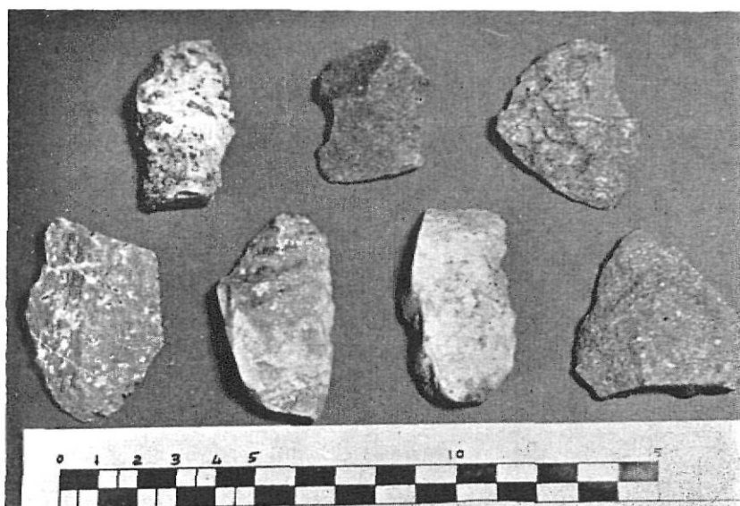
L'Arbreda. - Materials del Paleolític Mitjà.

dibuixat a escala 1/5. Com que aquestes feines impedeixen treballar en els quadres, i com ja s'havia acabat el dibuix de la secció Sud del pou i s'hi havien col·locat els colors, es va poder començar B2, C2 i D2. Havíem calculat que C2 serviria per treure'n la granulometria, però després dels primers estrats hi va sortir un gran bloc que ocupava tot el quadre, sense poder trobar la manera de fer la terra suficient. Això va obligar a passar la granulometria a C3. En aquest quadre s'excavava en estrats artificials de 5 cm., i de cada un d'aquests estrats en guardàvem una galleda per fer la granulometria d'elements grossers, i dos sacs de 3-4 Kgs. per fer la granulometria dels elements fins, un per analitzar a París pel Dr. Miskowsky, i l'altre per analitzar a Banyoles, pel Sr. Sanz.