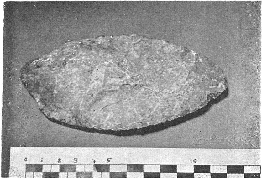
L'Arbreda. La gran fulla Solutriana.

permetien retenir les dents de les més petites ratetes. Un cop secs es triaven, guardant dents, óssos, resquills de sílex o quars, petxines i qualsevol altra cosa interessant, retribuint-ho tot després i classificant-ho per quadres i estrats. Tots aquests objectes donaran també precioses informacions, i fins i tot algunes, com les dents de rateta o les petites petxines, són un valuós element de datació.