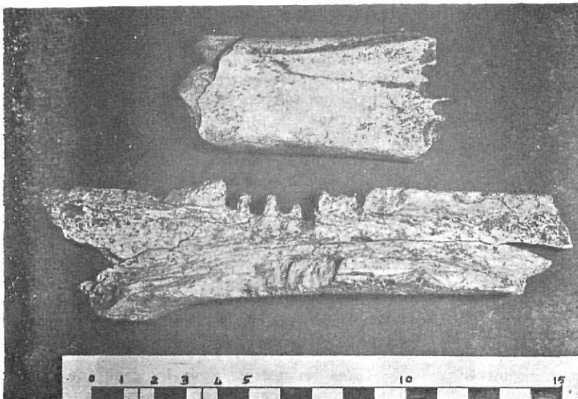
L'Arbreda. - Os amb incisions de rosegador.

que són un pas necessari per arribar al Paleolític Mitjà dels nivells inferiors. Els materials no són pas d'una gran riquesa en el sentit de molt de sílex ben treballat, però això mateix és una dada més que ens ajuda a entendre la vida dels homes que vivien en aquestes coves. A la comarca de Banyoles el sílex és molt escàs, i les cines més corrents els era més fàcil fer-les de quars, quarsita o pedra calcària compacta i de fractura concoïdal. Es per això que el que més abunda són els rierencs tallats i els resquills d'aquests materials. Particularment interessants són els dos sòls, el solutrià i el perigordià, als quals provisionalment es pot atribuir una data entre els 30.000 anys a Cr. pel segon i els 20.000