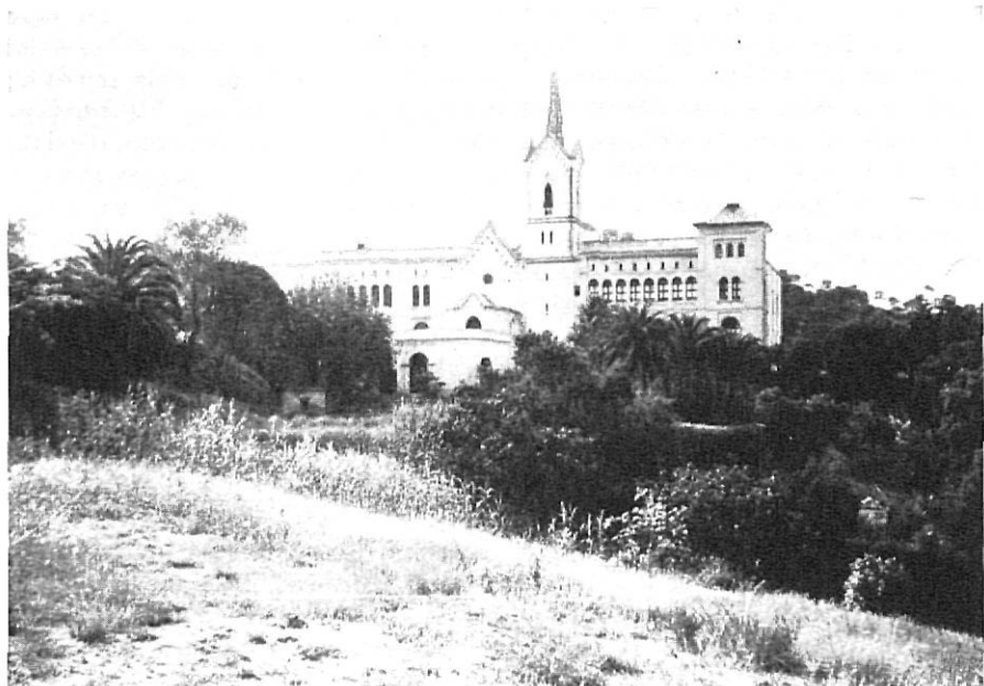
Sant Pere del Bosc.

Alçant els ulls, des de qualsevol paratge de Lloret, s'albira un monument altíssim a la llunyania, cap a bosc. Indiscutiblement crida l'atenció i el desig d'anar-hi fins el lloc d'emplaçament per veure'l de prop és intens. Es conegut per «l'Àngel» i s'alça sobre un turó, no gaire lluny de l'ermita de la Mare de Déu de