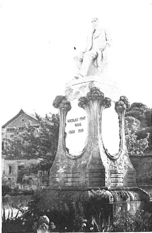
Sant Pere del Bosc; Monument a Nicolau Font i Maig

dre pels ancians, derivats de la situació de l'edifici, va fer decidir posteriorment al Patronat a establir un acord amb l'Ajuntament, qui, en virtut del qual i permuta de bens, ha edificat l'asil al costat de l'Hospital Municipal, al mig de la vila.