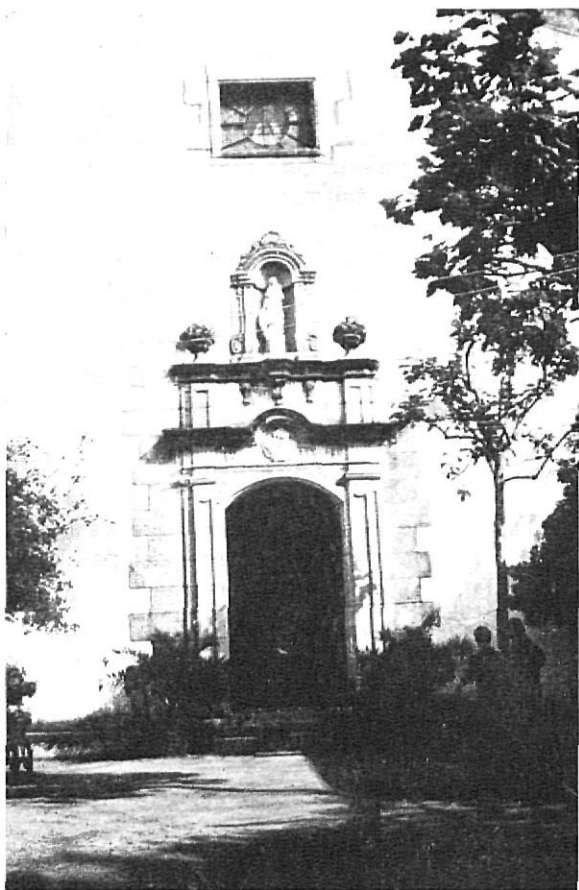
Entrada a l'ermita de Santa Cristina