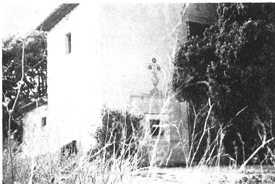
Ermita de St. Quirze

L'ermita de la Verge de les Alegries, dita abans de la «Mare de Déu de l'Antiga», i també «Nostra Dona de Palom» és un altre racó molt