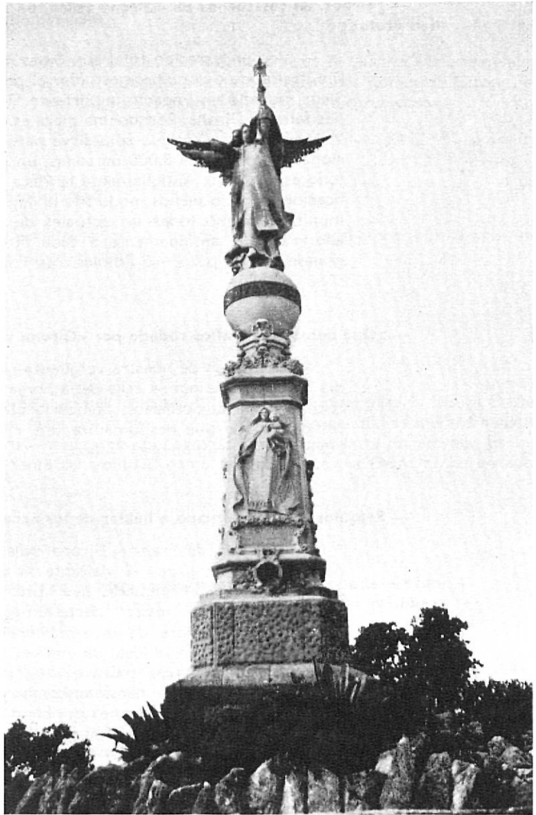
L'Angel. Als peus de l'imatge de la Mare de Déu, la quarteta verdagueriana i el bust del gran poeta català.