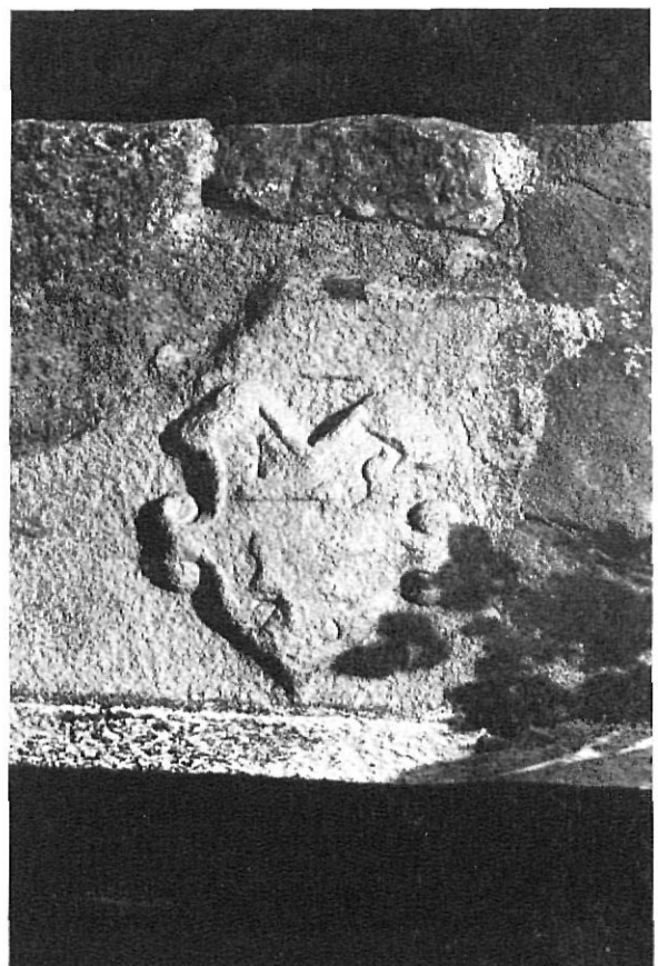
Dintel del año 1576 conservado en la plaza de Púbol.

En el extremo Sur de la plaza mayor se halla una casa en excelente estado de conservación, en cuanto a su estructura, dotada de una gran puerta dovelada y de una ventana con ajimez, de tipo gótico «triumfal», cuyos lóbulos superiores afectan forma casi circular rematada en punta que nos parece corresponder a principios del siglo quince. Parece, por la riqueza de su estructura, que corresponde a un edificio oficial, quizás la curia de justicia del barón.