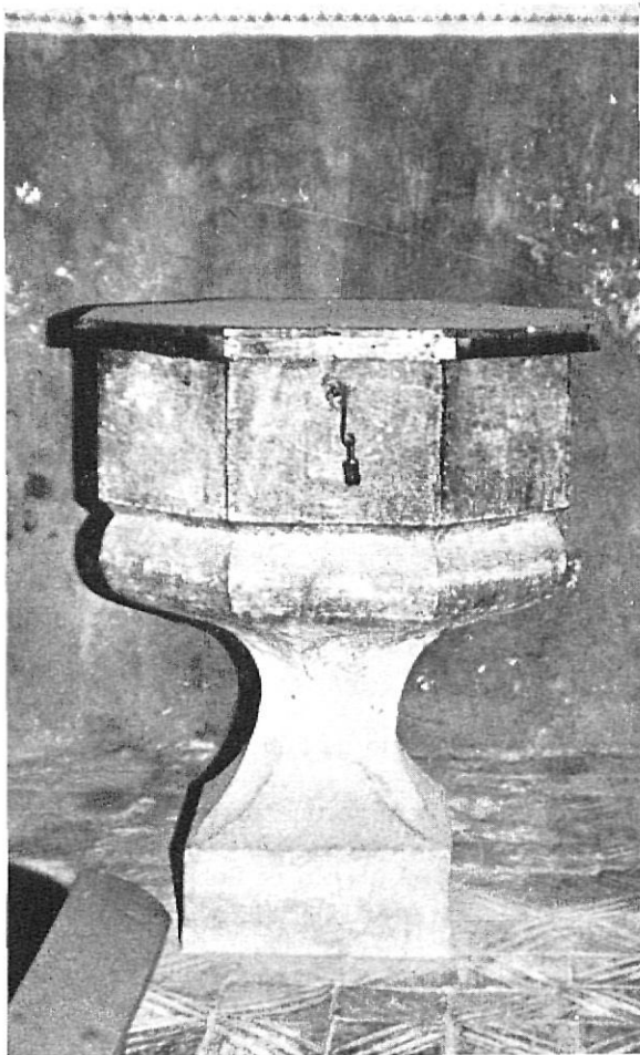
Pila bautismal de piedra labrada.

desde La Bisbal. Una escaramuza realizada en Monells acarreó a Montanyans la pérdida de unos caballos de su propiedad.