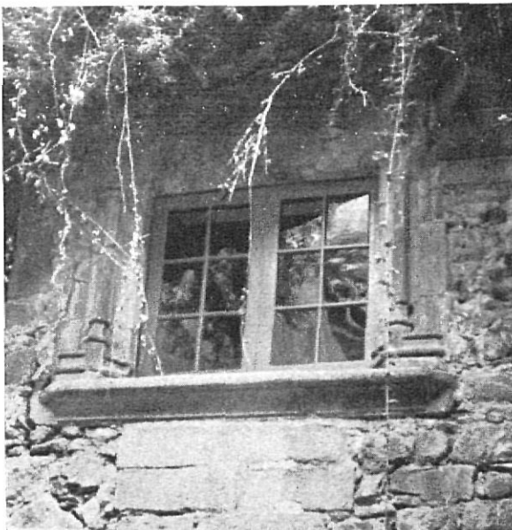
Ventana de principios del S. XVI.

monte flordelizado de gules. El linaje de Vilademany, oriundo, al parecer, del vecindario de este nombre perteneciente al pueblo de Aiguaviva, traía escudo cuartelado: en 1.º y 4.º, en campo de plata, una cruz floreteada de gules; en 2.º y 3.º, en campo de plata, tres fajas de azur.