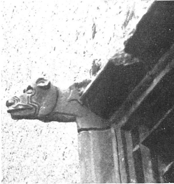
Detalle escultórico de una ventana.