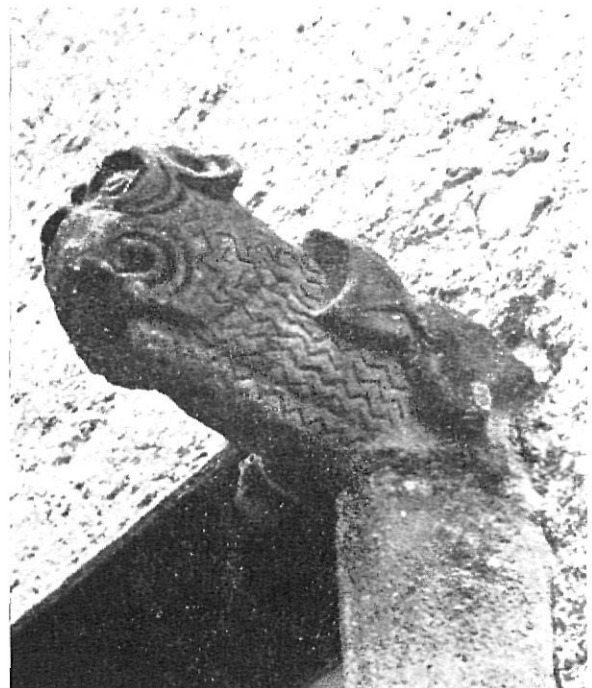
Otro detalle escultórico.

Su sucesor, don José de Tormo y de Vilademany, que residió y falleció en Púbol, tampoco grabó sus escudos en el castillo, si no es alguno de los indescifrables pintados en la sala principal. El de Tormo traía en campo de oro, un