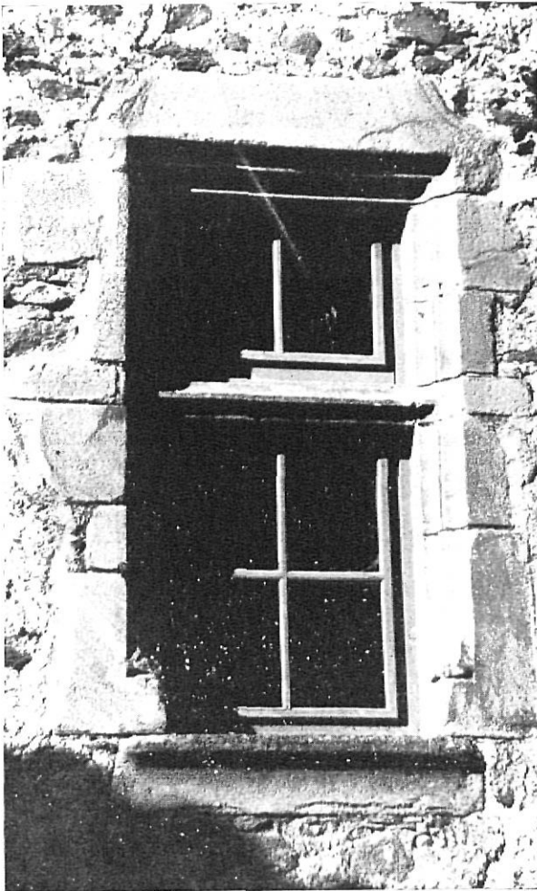
Ventana gótica tardía.