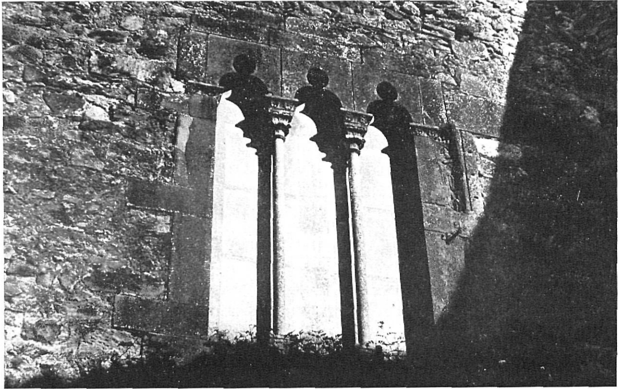
Ventanal ajimezado en el castillo de Púbol.