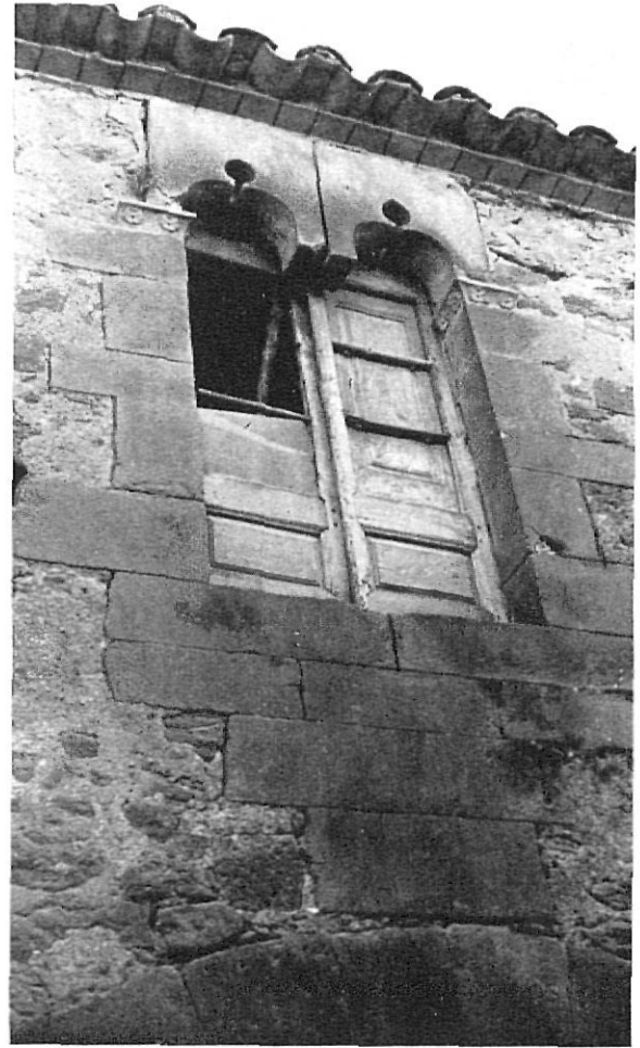
Ventana ajimezada de la casa gótica