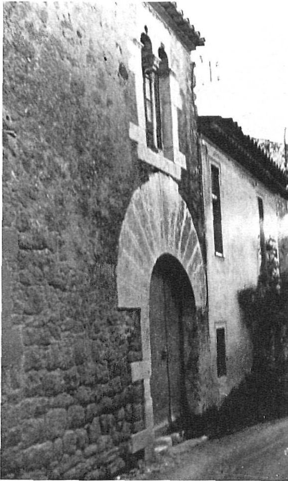
Casa gótica en la plaza de Púbol.