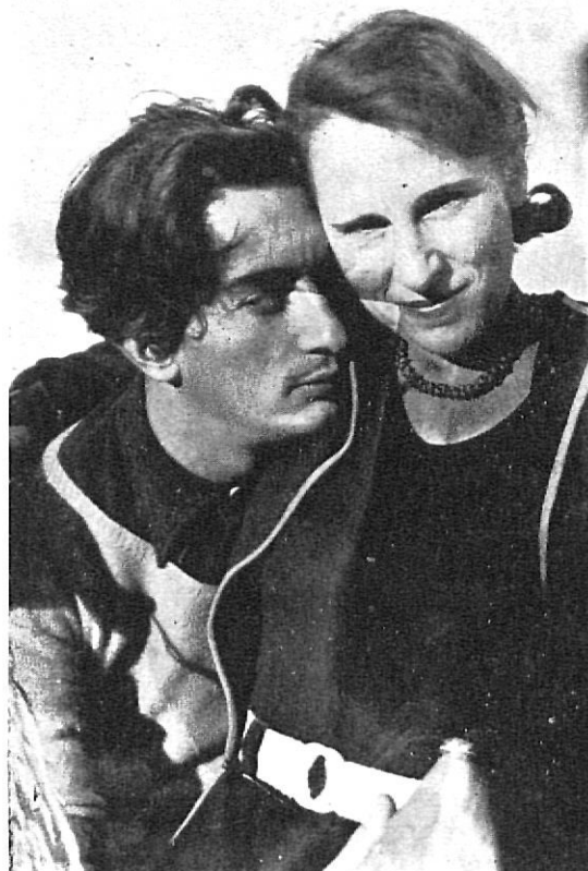
Gala i Dalí anys enrera

Què més podria dir-vos de l'amistat i coneixença amb en Salvador Dalí? Les converses, que amunt i avall de la RAMBLA, han anat mantinguent sempre la nostra amistat; les hores passades al Cafè, i a la Terrassa de L'Emporium llavors d'en ROGET; recordo, precisament el dia de les eleccions de Consellers l'any 31.