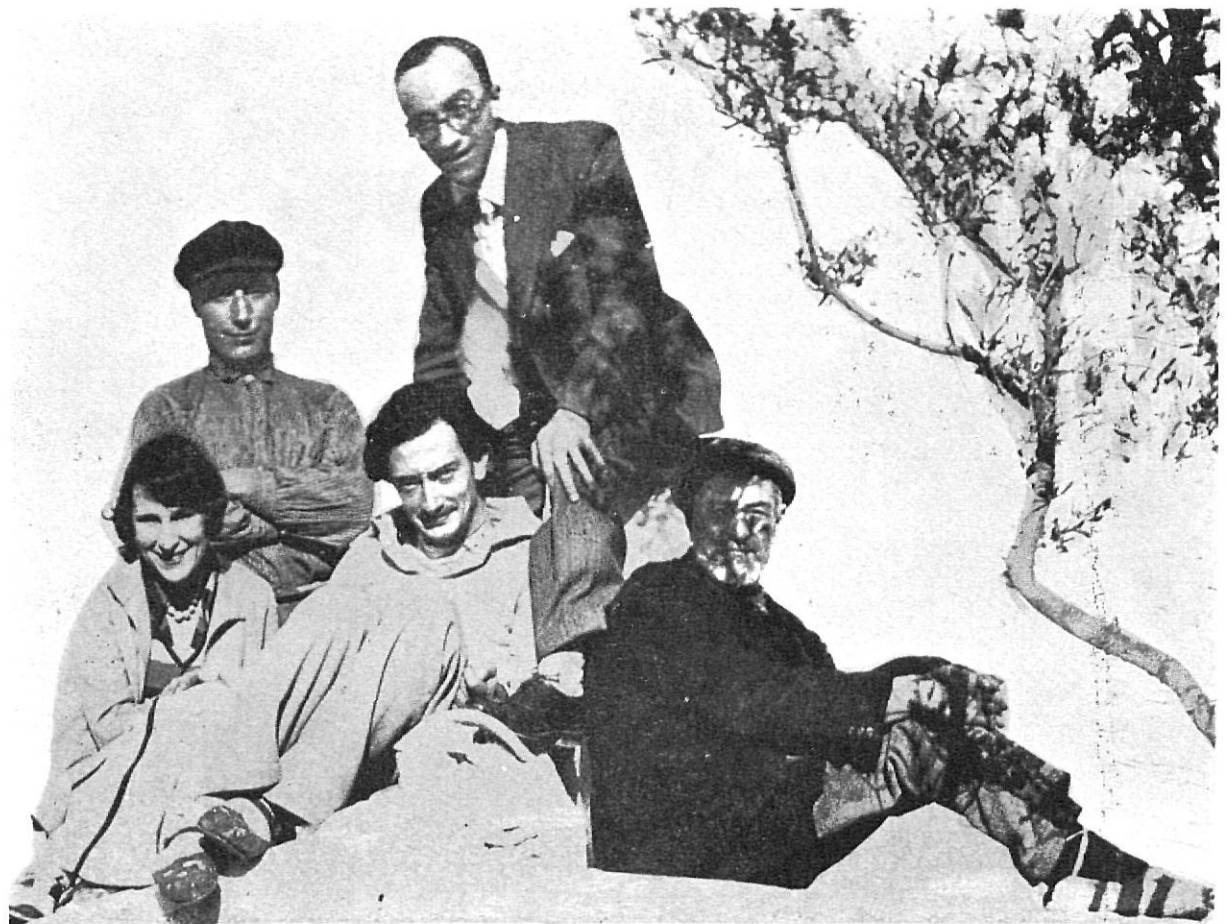
Gala i Dali, amb l'autor de l'article