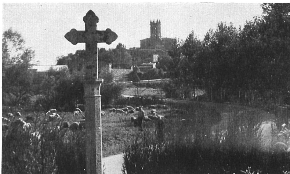
Estampa idílica de La Pera

Ya en el exterior, puede admirarse con detenimiento la fachada, toda de piedra de sillería del país. La puerta inicialmente era muy simple, con dos arcos en degradación y arco de medio punto. Tiene un reborde exterior apoyado sobre unas ménsulas esculpturadas, cuyo motivo ha sido borrado por el desgaste del tiempo. En el siglo quince se añadió a esa portada un dintel horizontal esculpturado, en el cual se representó el blasón de las familias Campllong-Corbera. En el tímpano resultante se colocaron calados con lados ondulantes y arcos muy apuntados, propios del estilo flamígero del siglo quince.