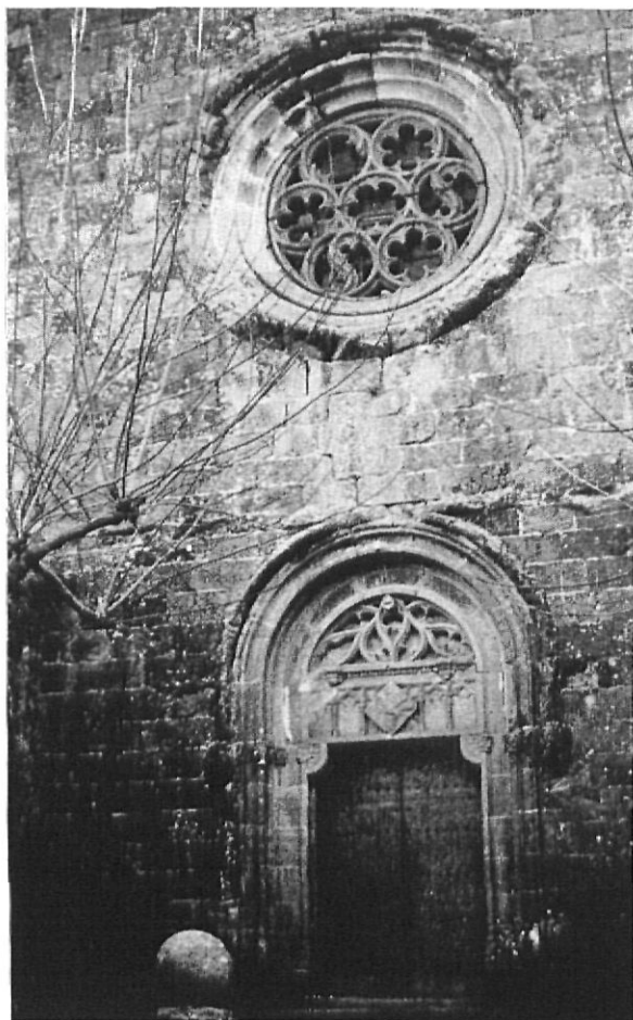
Fachada de la iglesia de Púbol