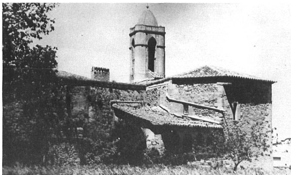
Púbol. — Campanario ábside y parte del castillo

documentos del siglo catorce, las cuales desembocaron en la construcción de la iglesia de Púbol para separar todo trato entre los hombres de La Pera y los de Púbol.