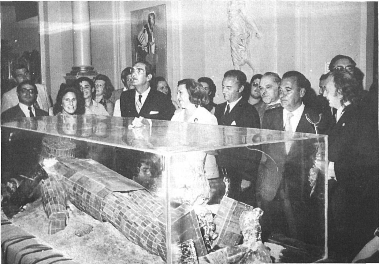
Entre Dalí y Gala, los ministros, autoridades y personalidades contemplan la "momia China" expuesta en el Museo Dalí el día de la inauguración de la exposición de joyas.

La inauguración de la exposición de joyas de Salvador Dalí en el que será «Museo Dalí», fue otro acontecimiento destacado del que da cuenta nuestro corresponsal en el Ampurdán.