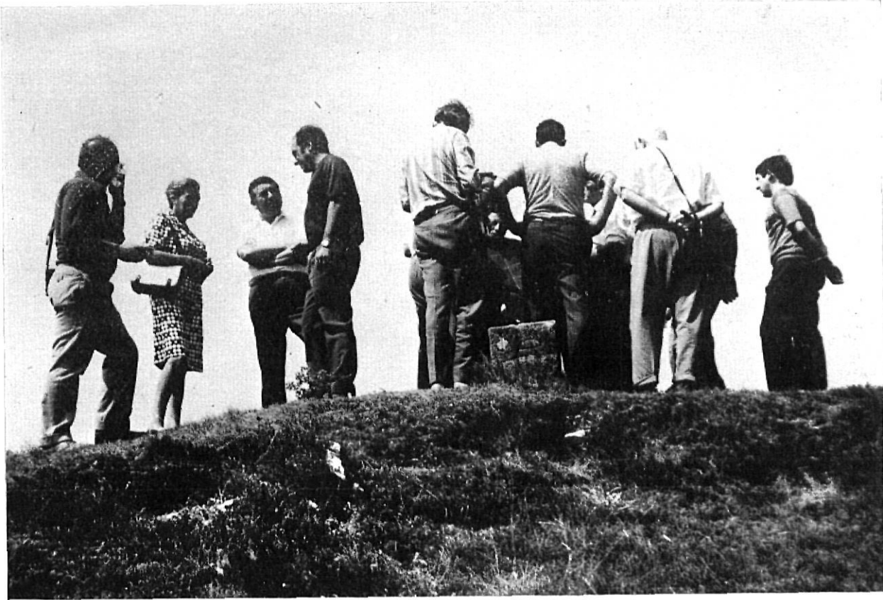
Ante el mojón que señala la separación de las provincias de Barcelona y Gerona en "Coll de Bracons" en visita del Presidente de la Diputación, lugar por el que pasará la carretera Torrelló-Olot, se inspecciona el proyecto.

Naturalmente, las Corporaciones que van configurándose con un carácter empresarial, han de tropezar con numerosos problemas de tipo financiero. También el Estado. Es y será permanente el desfase entre las necesidades y las nobles ambiciones que todos tenemos hacia nuestra provincia y hacia nuestra patria, con las posibilidades reales con que contamos.