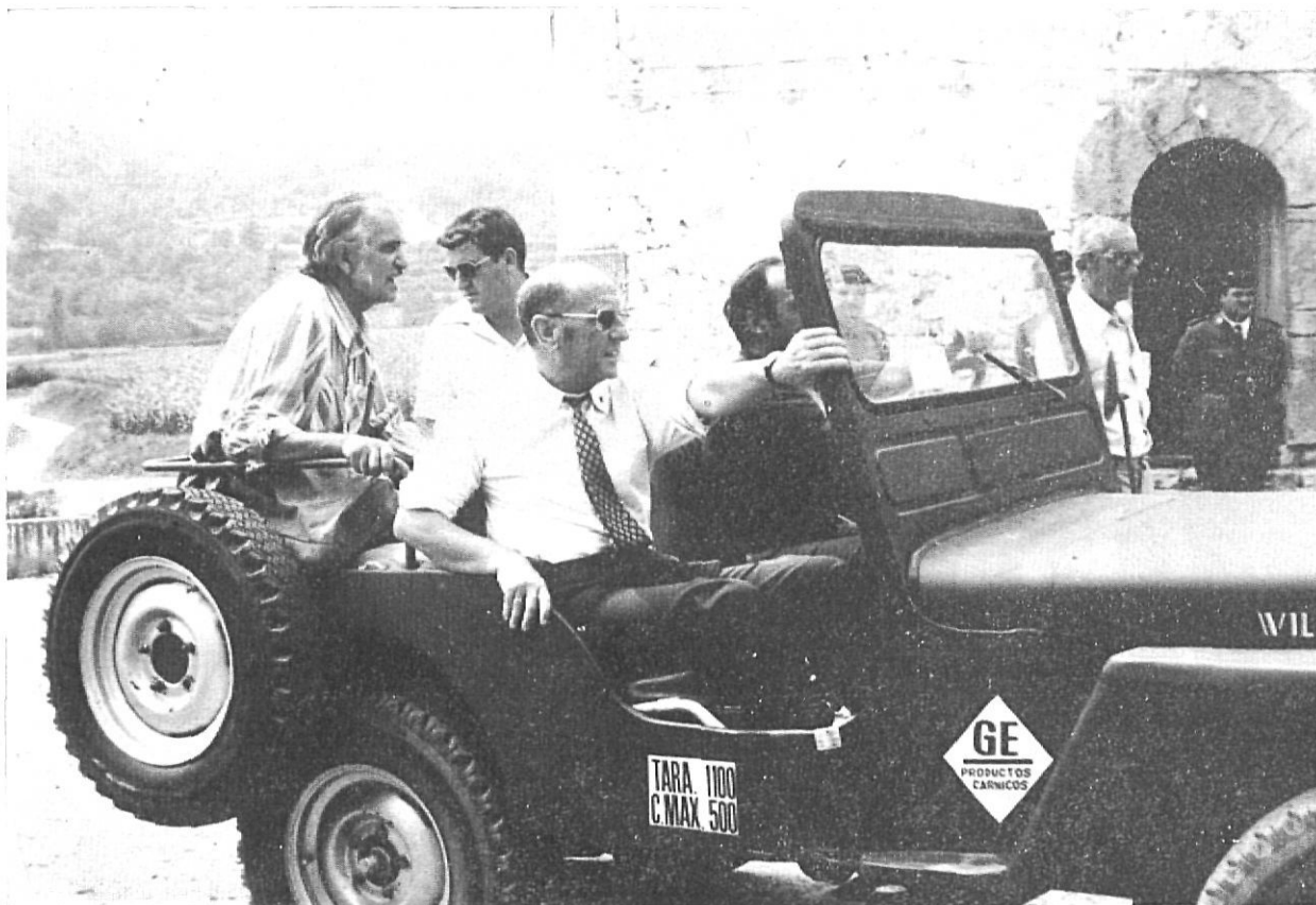
El Sr. Presidente en Oix, iniciando el viaje hacia Baget por antiguos senderos.