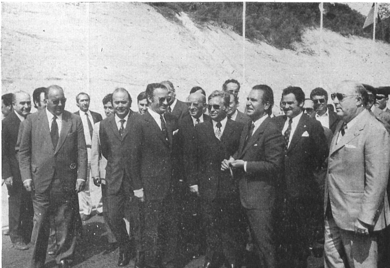
El Ministro de Obras Públicas, inaugurando el tramo Vidreras-Lloret de Mar, en presencia de autoridades y personalidades.