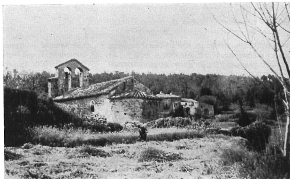
Iglesia de Pedrinyà de la baronia de Púbol