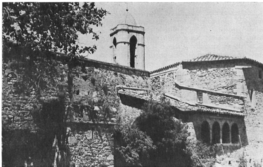
Fachada Este del castillo de Púbol

El docto archivero catedralicio Sulpicio Pontich creyó que el documento databa del año 1021, sin duda porque así fija él la fecha del documento que viene a continuación en el Llibre Verd , que por venir datado por los reyes de Francia, permite variantes e nsu interpretación.