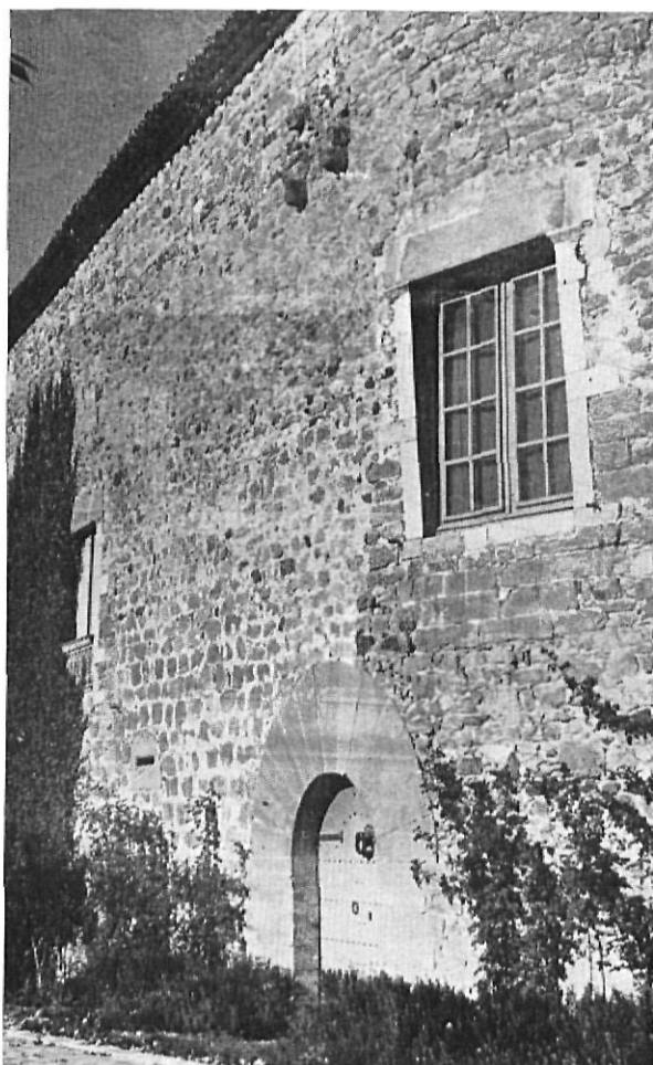
Puerta dovelada del castillo de Púbol con restos de la barbacana que la defendía

Es obvio que desde remotas edades el hombre ha pasado por los parajes que después constituyeron el término de la baronía de Púbol y hoy persisten en el término de la parroquia del mismo nombre. No obstante, carecemos de noticias concretas y de vestigios de su estancia en el mismo. Ni la toponimia ni la observación de los estratos del terreno ni los hallazgos casuales de utensilios, de cerámica, de vidrio o de monedas nos han prestado ayuda en nuestras investigaciones.