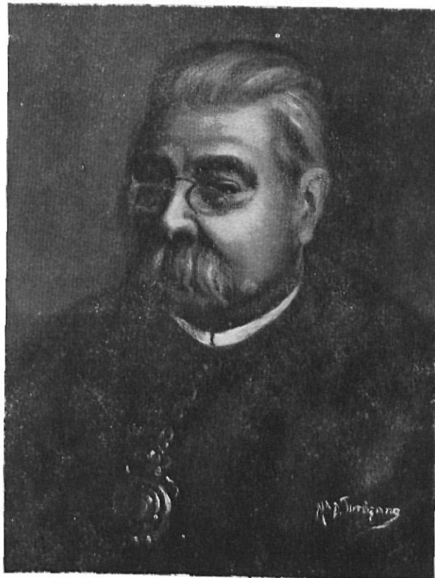
Manuel Durán y Bas