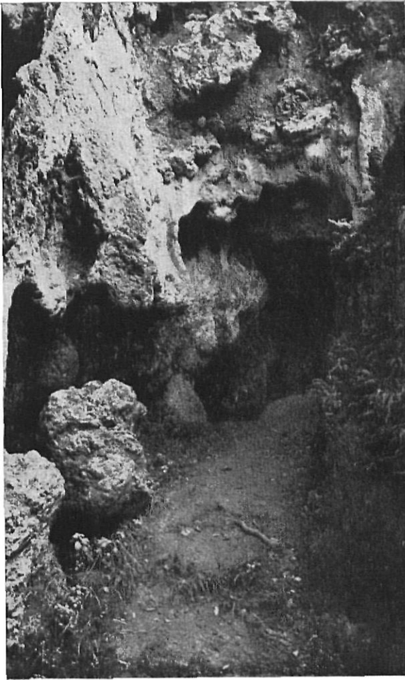
SERIÑA Cuevas de Reclau