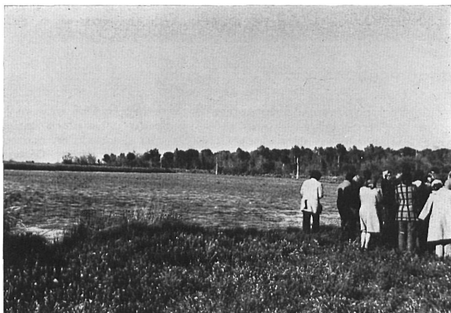
Grupo de cursillistas en una visita al lago de Esponellá.