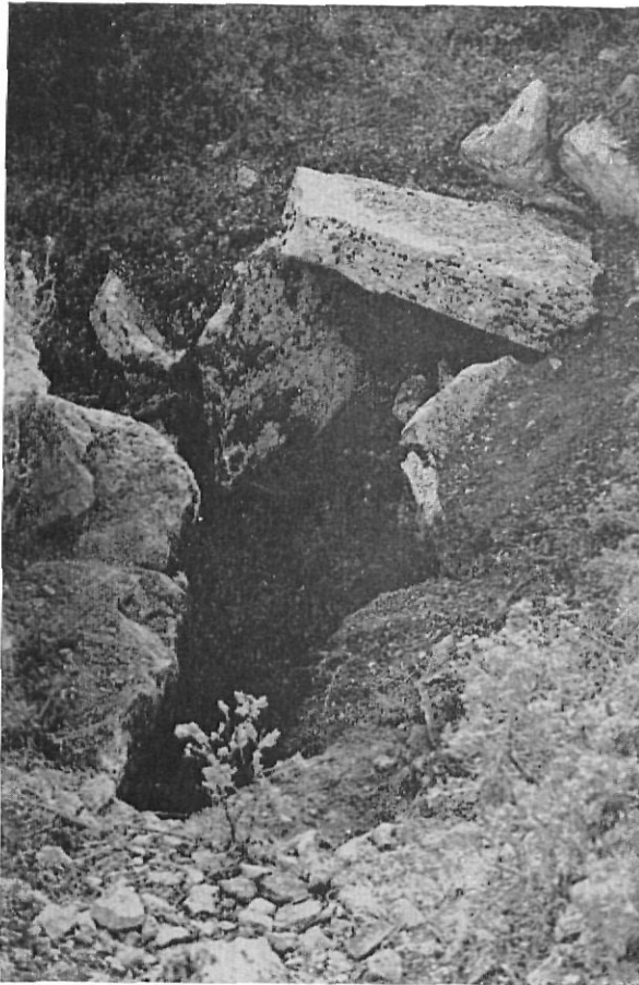
FIG. 1. — La cueva-dolmen del Tossal Gros. Al fondo, el dolmen cuya cubierta está asegurada mediante tres piedras clavadas verticalmente; al centro, la parte destruida del dolmen gracias a lo cual se ve la pendiente por donde se desciende a la covacha; a primer término, la parte estrecha de la grieta, donde probablemente estuvo la entrada.