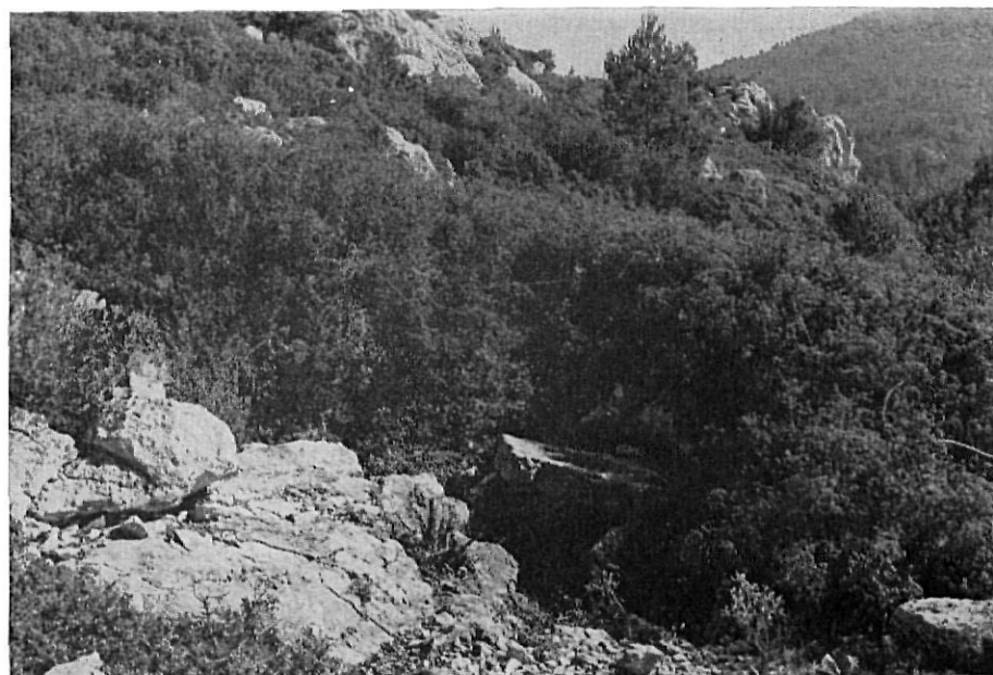
FIG. 2.—La cueva-dolmen del Tossal Gros estaba al centro de un túmulo formado, en parte, por la misma roca natural que dio origen a la covacha.