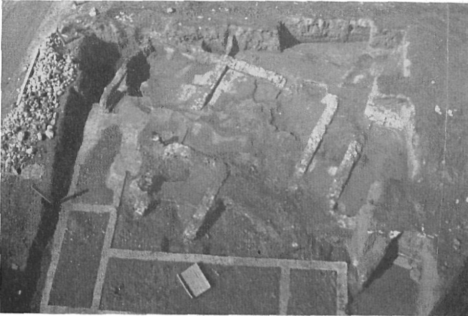
SARRIA DE DALT. — Villa romana, zona des- cubierta en 1970-71. Los cimientos de la parte inferior, moder- nos.