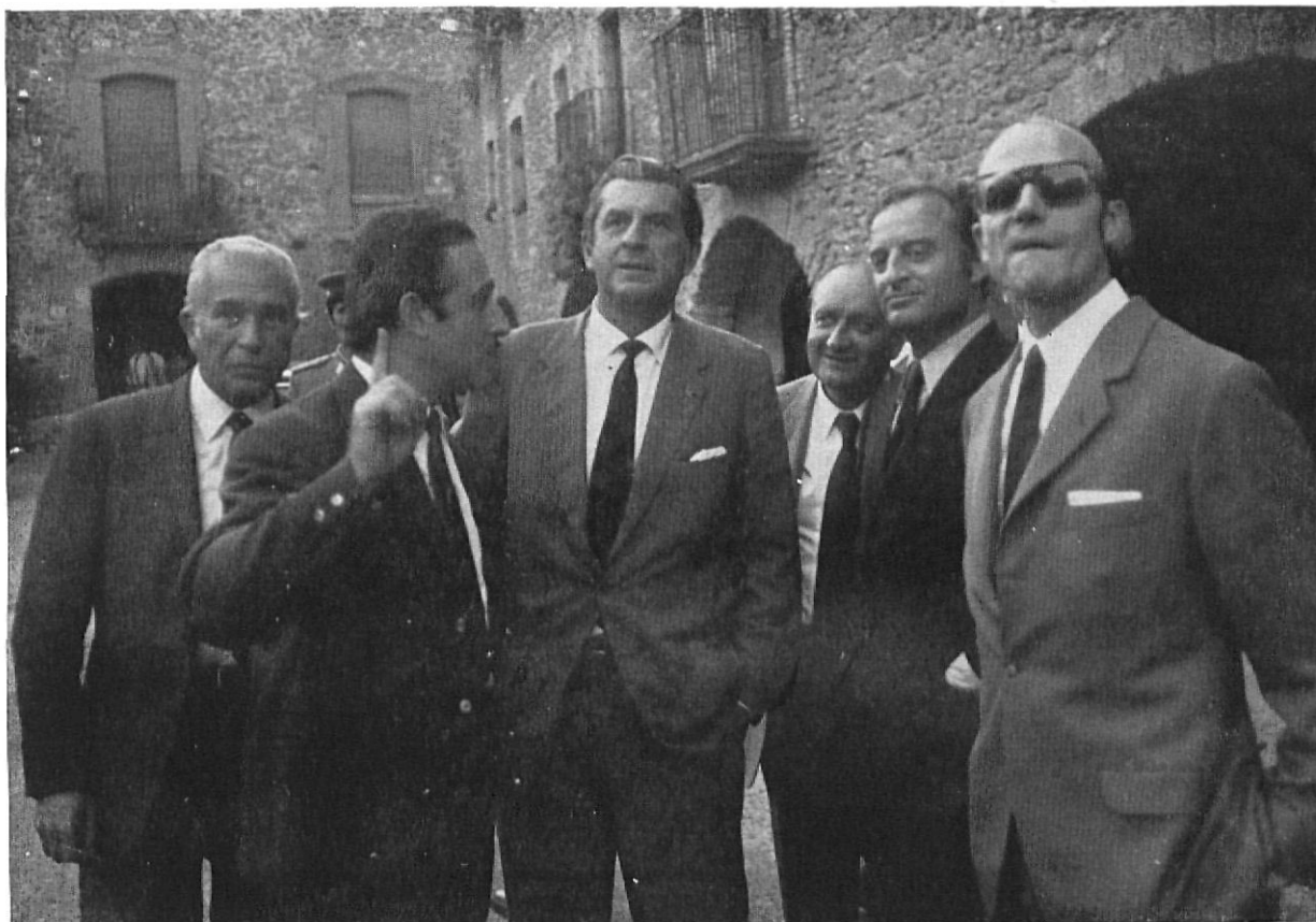
En su periplo rural, el ministro de Agricultura visitó las instalaciones de la Granja Experimental de la Diputación en Monells, y aquí le vemos en la plaza de dicha población