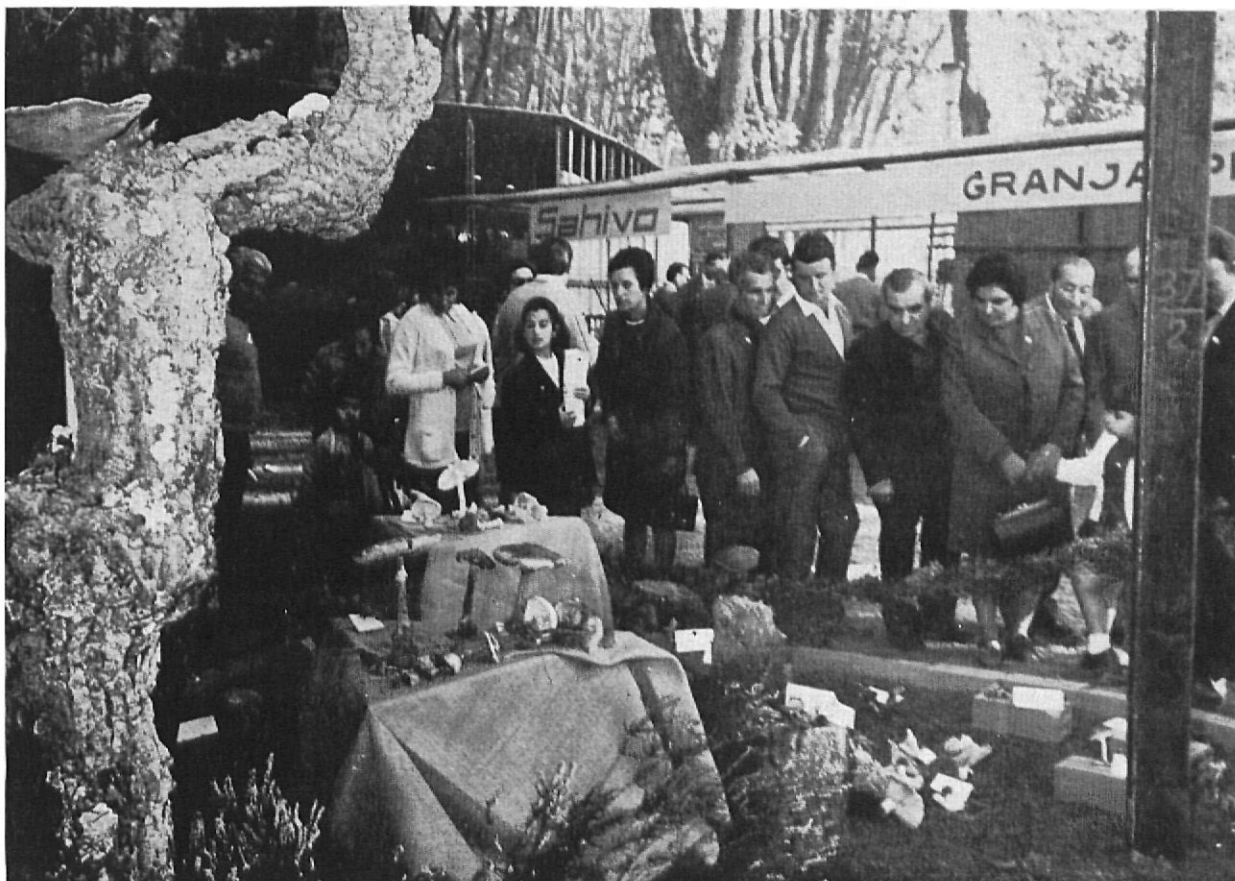
Dentro el recinto del "Certamen Agrícola y Comercial" tuvo lugar una interesante exposición de setas.