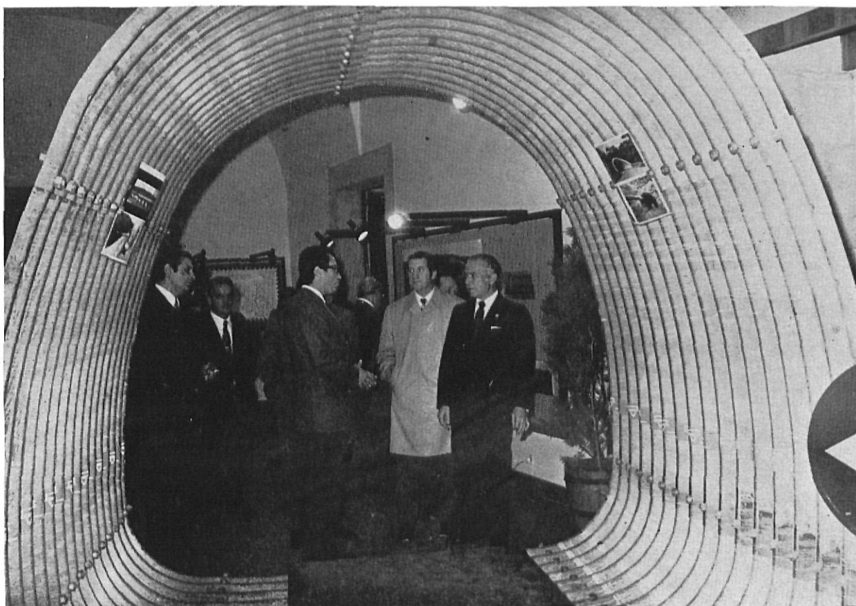
Una perspectiva de la "Expovia" celebrada en las Salas de Exposiciones de la Casa de Cultura.