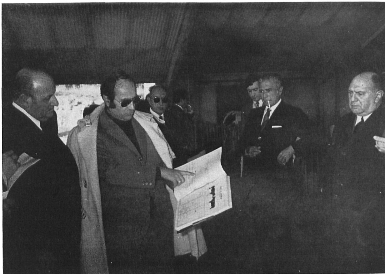
Tras la "Rueda de Prensa" celebrada por la Diputación en Monells, fueron mostradas a los informadores, las dependencias de la Granja Experimental, uno de cuyos momentos recoge la fotografía de Sans.