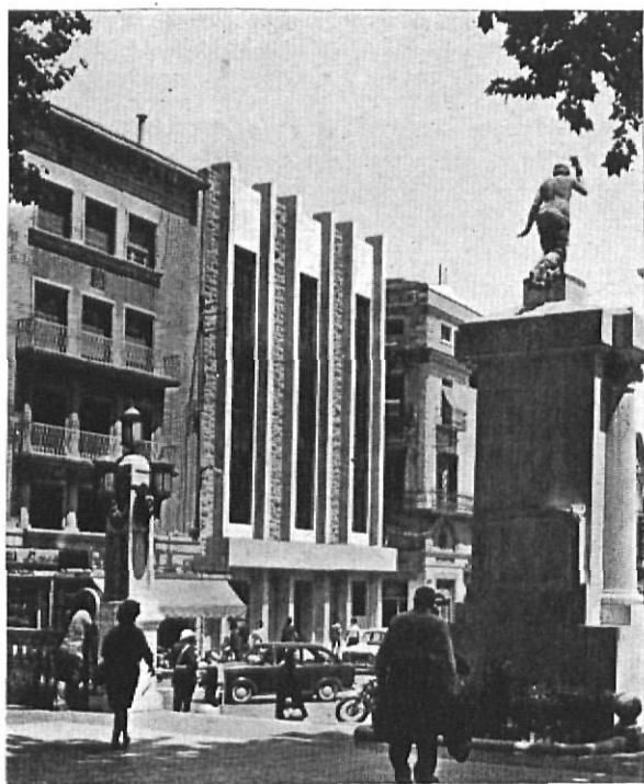
Una vista de la fachada del nuevo Museo del Ampurdán