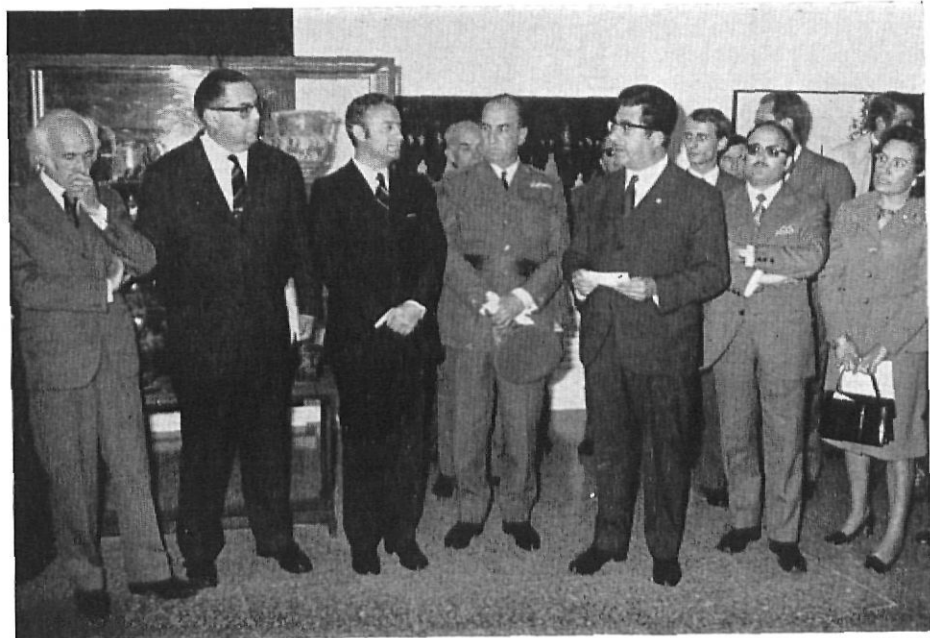
El alcalde de Figueras, saludando a las autoridades

la antigua Cámara Agrícola. Se trataba de un edificio de principios de siglo, con entramados de madera y unos adornos en fachada también de madera.