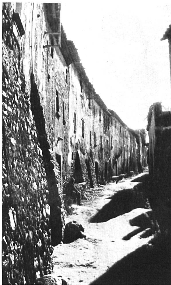
MONELLS. — Típica calle de comunicación entre el castillo y el mercado

En la parte Sur se limitó la plaza mayor con otra manzana de casas igualmente porticada, que comunicaba con los edificios que pueden