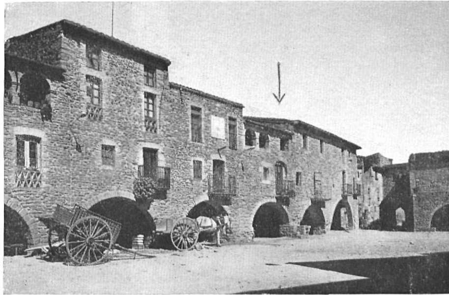
Plaza de Monells, la flecha señala un ventanal con arco de herradura.

tiempo transcurrido y el escribano no podía tener grandes dificultades en la interpretación de la escritura.