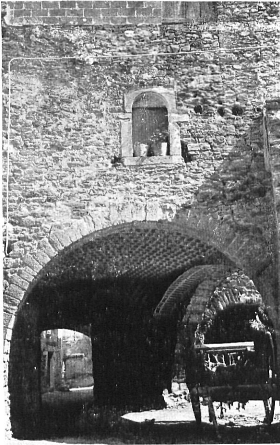
Vista de la plaza del Aceite