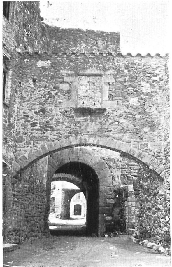
Entrada del mercado de Monells

Se considera tiempo inmemorial el espacio de noventa años porque para perderse la memoria de un hecho tan trascendente ha de pasar más de una generación; así que podemos retrotraer por lo menos hasta los comienzos del siglo once la concesión del mercado de Anyells.