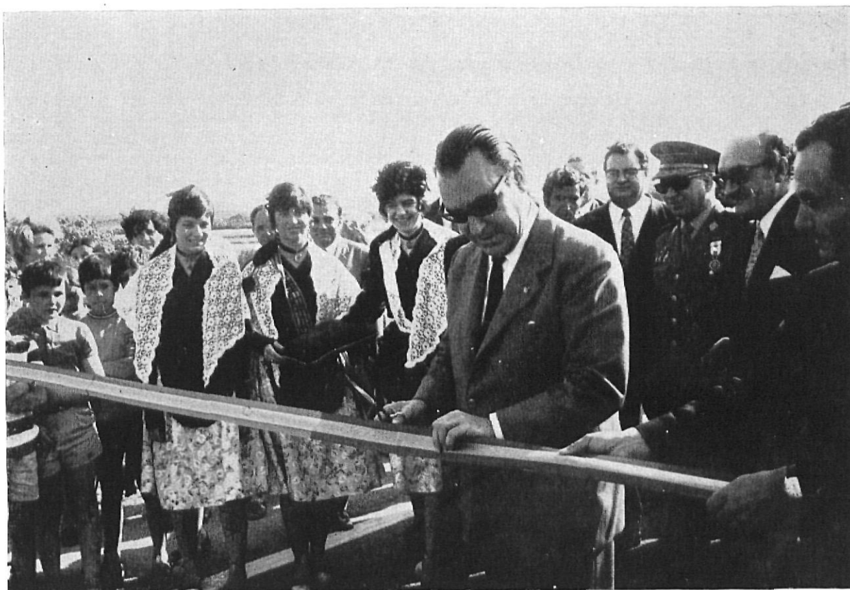
En Vidreres, cortando la cinta del nuevo acceso de la Autopista a la Costa Brava