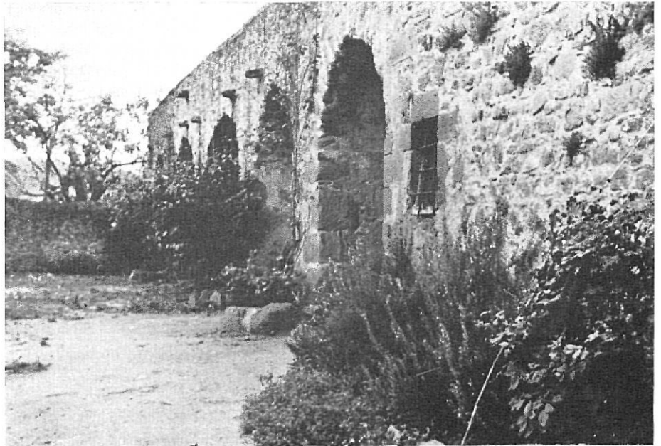
Mas Savalls de La Pera