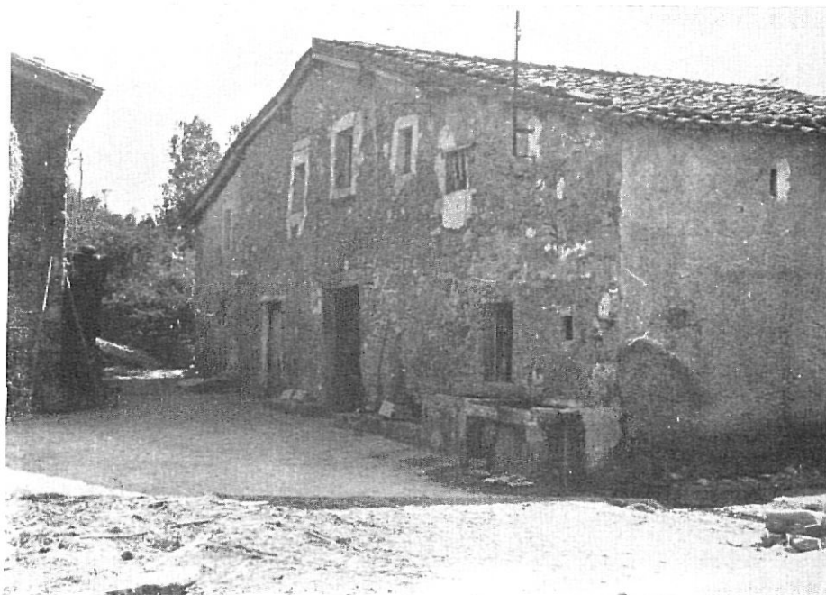
Riudaura: L'Hostal de la Corda