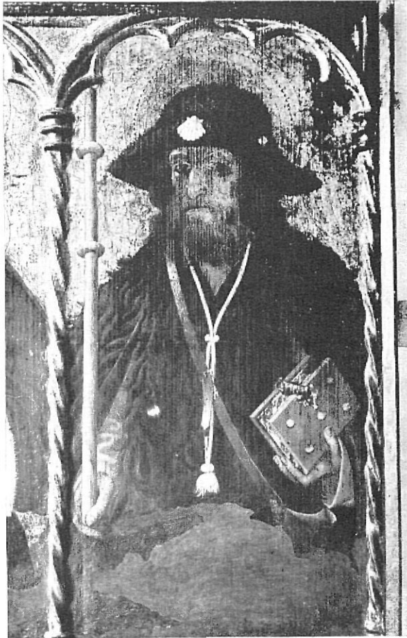
Retablo de Púbol - Detalle